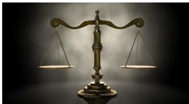
Figura - 1 Justiça

Na concepção do pensamento crítico, quanto mais aberta, reflexiva e discutida for uma ideia, um problema, uma questão ou um contexto, a sua probabilidade de ser universal, será maior.