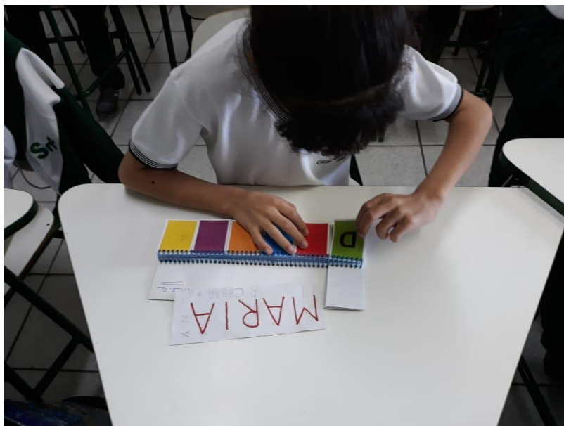
Reconhecendo as letras do nome.