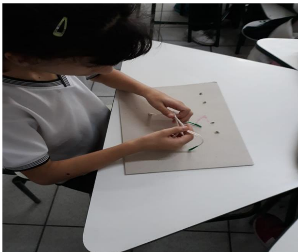
Trabalhando coordenação motora.