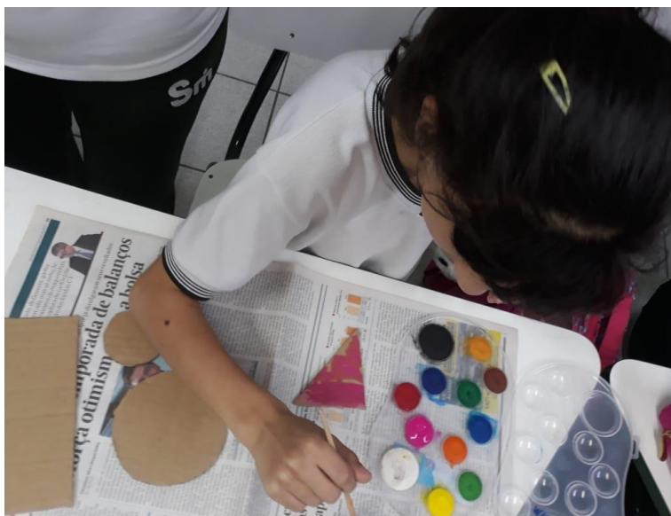
Trabalhando cores e formas.