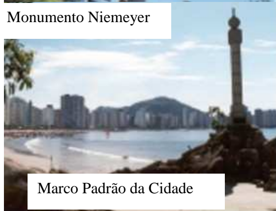
Marco Padrão da Cidade

Monumentos atuais da cidade – fonte: Márcia Vale