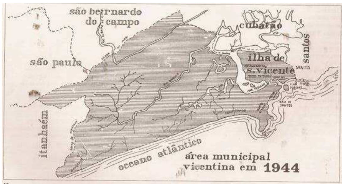
Mapa geográfico da cidade em 1944

A partir da década de quarenta, com as ratificações divisórias entre Santos e São Vicente, uma extensa região vicentina foi anexada a Santos, área que hoje compreende os populosos bairros do Jardim Rádio Clube, Bom Retiro, Caneleira, Areia Branca e proximidades.