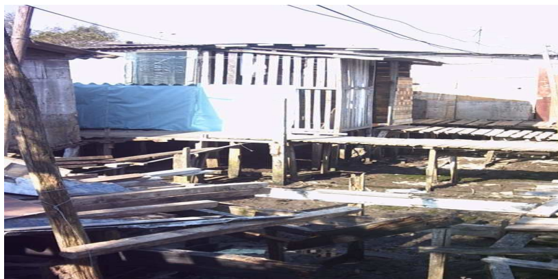
Casas construídas em cima do Rio Mariana, no interior do bairro

As fotos mostram o avanço das casas na mata ao redor do Rio Mariana. Esses habitantes vivem em estado precário de saúde e higiene, embora busquem a legalização das habitações. Não sabem informar nenhum detalhe legal sobre o assunto ou se os órgãos públicos têm planejamento para construir ruas e praças no local.