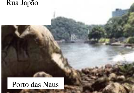
Porto das Naus