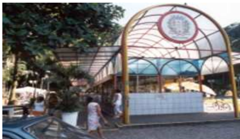
Praça de doces situada na Biquinha de Anchieta

Foram reformados outros pontos turísticos, como o Engenho dos Erasmos, o Porto das Naus, o Marco Padrão e a Rua Japão. As reformas trazem para a cidade desenvolvimento socioeconômico e turístico, o que promove suas belezas e conserva as tradições, como os doces da Biquinha e a venda de peixes na Rua Japão, pescados artesanalmente pelos moradores locais.