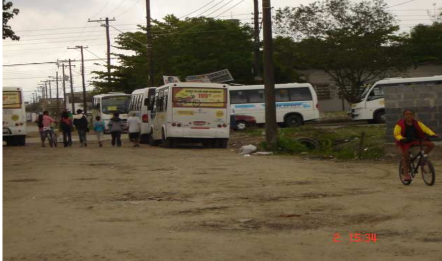
Ponto final da Vila Emma em 2006

A Vila Emma é um dos menores bairros dessa região e, segundo a prefeitura, “começa no cruzamento da linha divisória entre os municípios de São Vicente e Praia Grande com a Rodovia Pe. Manoel da Nóbrega, segue pelo eixo desta até o cruzamento com a linha férrea da Rede Ferroviária Federal S/A – Malha Paulista, Ramal Juquiá e com a linha férrea da Companhia Paulista de Trens Metropolitanos; deflete à direita e segue por uma linha imaginária traçada perpendicularmente à linha férrea da Rede Ferroviária Federal S/A – Ramal Juquiá , naquele entroncamento, até o cruzamento com a linha divisória entre os municípios de São Vicente e Praia Grande; deflete à direita e segue por esta até o ponto de partida”.