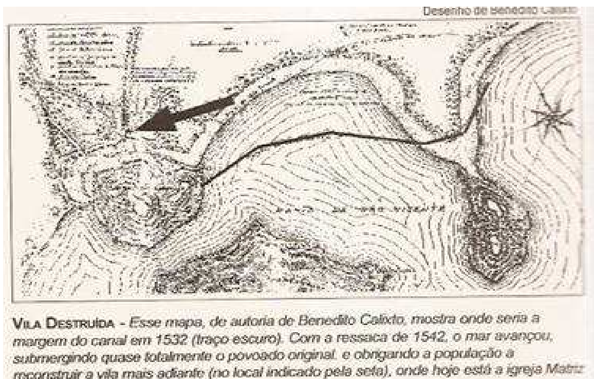
Foto do mapa de Bendito Calisto que mostra a região de SV em 1542