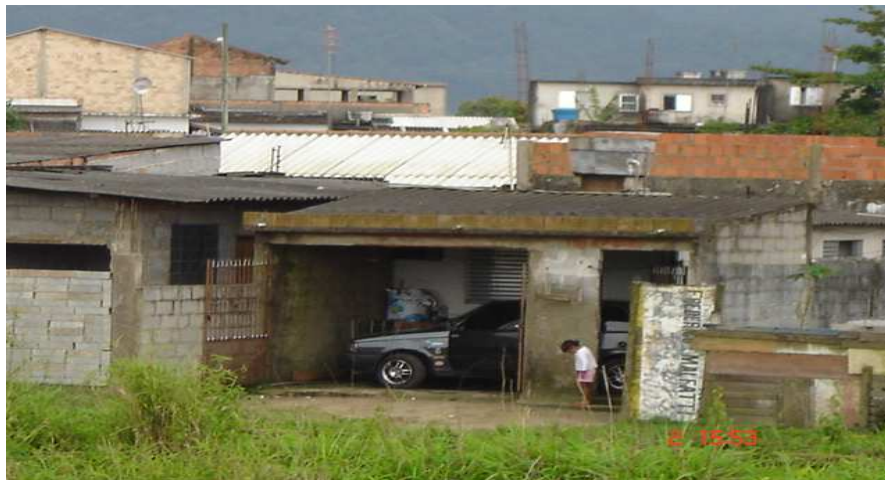
Casa típica desse bairro

Esta comunidade fica às margens do Rio Branco, com suas casas situadas nas baixas do rio, portanto, nas áreas de mangues. A população não tem a posse da terra porque é uma área de invasão. Seus moradores não compraram os terrenos e moram em