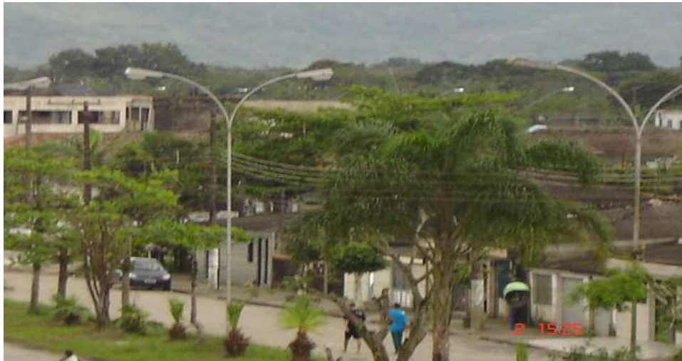
Foto tirada de cima da ponte sob a estação de Samaritá

Segundo a Lei Complementar nº2168 do Município de São Vicente, que se refere aos abairramentos que demarcam a cidade, “a Vila Samaritá começa no cruzamento da linha férrea da rede Ferroviária Federal S/A – Malha Paulista, Ramais Paranapiacaba e Juquiá, com a linha férrea da Companhia Paulista de Trens Metropolitanos – CPTM, segue por esta até o cruzamento com o prolongamento da linha divisória do loteamento Jardim Rio Branco, junto à Rua 15; deflete à direita e segue por um a linha imaginária traçada perpendicularmente à linha férrea da Companhia Paulista de Trens Metropolitanos, até o cruzamento com a linha divisória entre os municípios de São Vicente e Praia Grande, no Rio Piaçabuçu; deflete à direita e segue por esta até o cruzamento com a linha imaginária traçada perpendicularmente à linha férrea da Rede Ferroviária Federal S/A – Malha Paulista e a linha férrea da