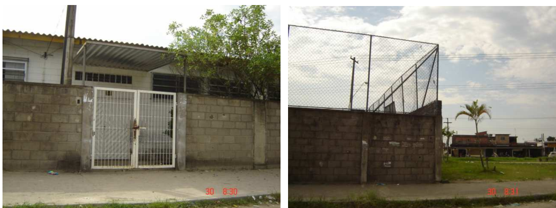
Entrada de professores e quadra da escola

A escola possui o maior número de alunos da região porque abriga crianças do Quarentenário, do Jardim Rio Negro, da Vila Ponte Nova e do Jardim Rio Branco. Com 1782 alunos, funciona, em 2008, com dois períodos e 52 turmas. Possui três salas de educação especial, uma é para atender deficientes auditivos, com oito alunos, e duas salas para deficientes mentais, com 21 alunos no total.