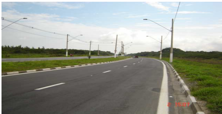
Via Angelina Prete duplicada que leva à área continental – Fonte: Márcia Vale