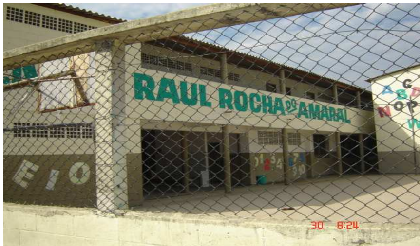
Foto da fachada da EMEF Raul Rocha do Amaral

A EMEF Raul Rocha do Amaral, na Vila Ponte Nova, foi construída em 1996. Possuía cinco salas, para abrigar a demanda escolar da época. Em 2006, passou pela terceira reforma em dez anos e abriga hoje 16 salas de aula, com 35 a 40 alunos em média. Para 2008, a proposta da Secretaria de Educação de São Vicente é que funcione com quatro períodos, sem intervalo entre eles, das 7 às 11 horas, da 11 às 15 horas, das 15 às 19 horas e das 19 às 23 horas, devido ao aumento da demanda escolar e à impossibilidade de construir uma nova escola no bairro.