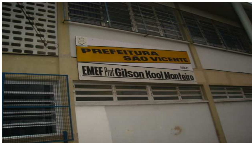
Prédio da escola

Os moradores do bairro têm respeito e não depredam o prédio, mas a escola é desprezada pela população e, por isso, todos os anos há salas ociosas. Seu acesso é difícil, e quando chove as proximidades ficam alagadas. Por esse motivo, há uma constante troca de funcionários e professores.