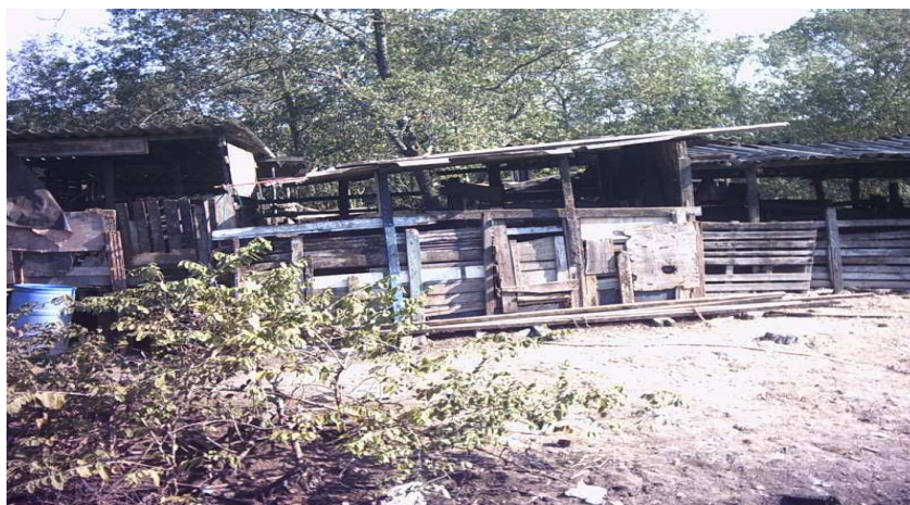
Depósito de carro velho