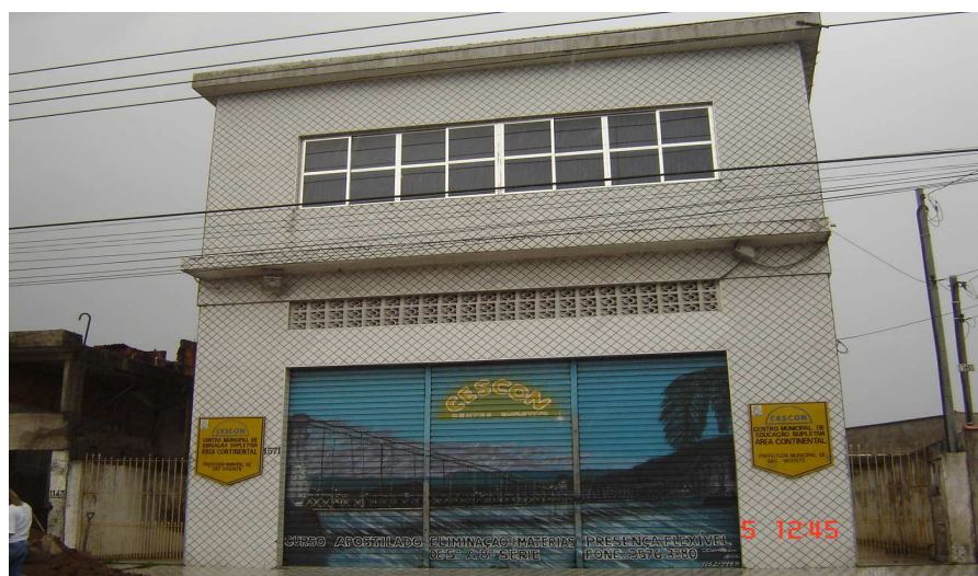
Prédio do Cescon quando fechado

O CESCO funciona diariamente, nos períodos diurno e noturno, e os alunos vão à escola para tirar dúvidas, no plantão dos professores. Essa modalidade de ensino