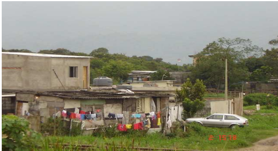
Imagem da parte da Vila Ponte Nova próxima a linha férrea

Outro bairro que se formou graças à invasão populacional foi a Vila Ponte Nova. Separado do Quarentenário pelos trilhos da FEPASA (Ferrovia Paulista S.A.), o bairro tem características peculiares quanto aos habitantes. Desde o início, do povoamento do local, a escola centralizou a dinâmica coletiva e aproximou esses moradores dos valores educacionais da ilha.