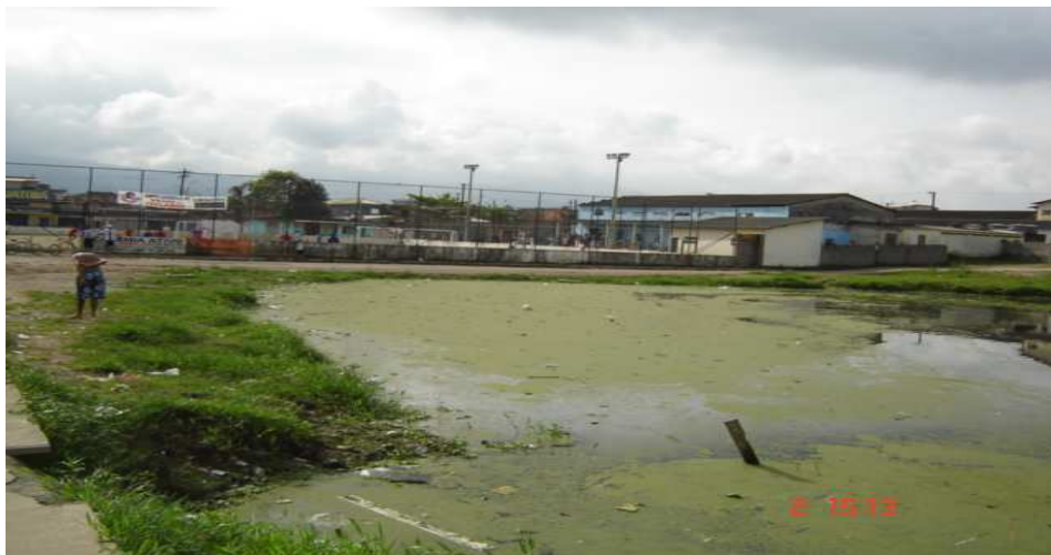
Lagoa onde os primeiros habitantes do Quarentenário pescavam.

O trajeto das invasões vai recebendo adesões de pessoas que se ligam pelo protecionismo das religiões. As pessoas que ali chegaram traziam o sonho do progresso e a vontade de consegui-lo com o suor de seu trabalho.