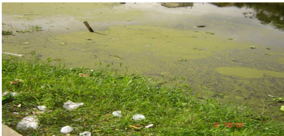
Foto de uma antiga lagoa de manguezais, hoje na entrada do bairro do Quarentenário

A rede hidrográfica que conflui para o Canal dos Barreiros compreende os rios Branco, Piaçabuçu, Mariana, Gragaú e Taquimboque, que desenvolvem percursos meândricos, característicos das baixas declividades da área.