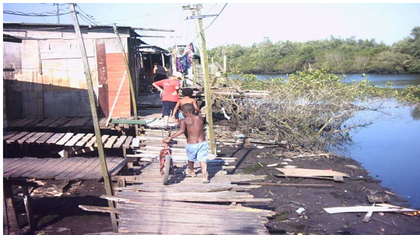
O término do bairro que beira o Rio Mariana

O sentido de comunidade mencionado por Bauman (2005: 11) traduz o estado de isolamento de pessoas que só se sentem seguras e livres enquanto estiverem no local que acham ser protegido. Parecem usar formas de experimentações as mais diversas