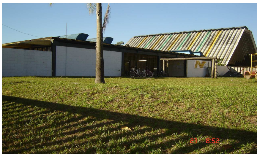
CAIC – vista lateral onde fica a creche.