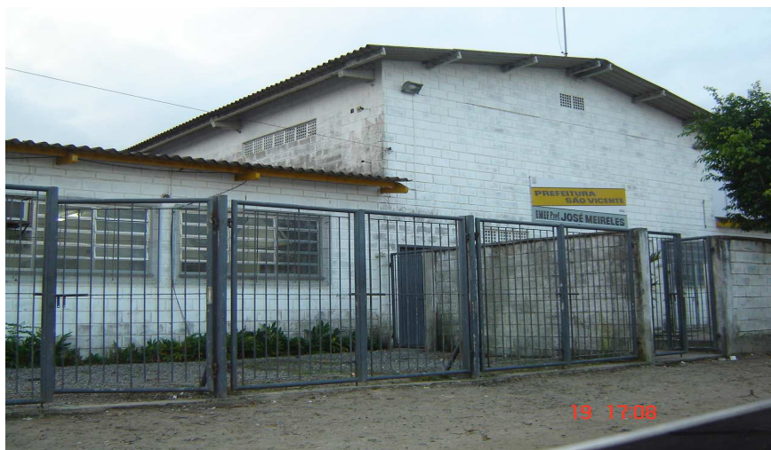
Entrada lateral e de alunos

Nos dias atuais, ainda é preciso cuidado com possíveis furtos de material ou depredações. Seu estado de conservação é bem diferente do das demais escolas dessa região e constantemente há troca da equipe de direção.