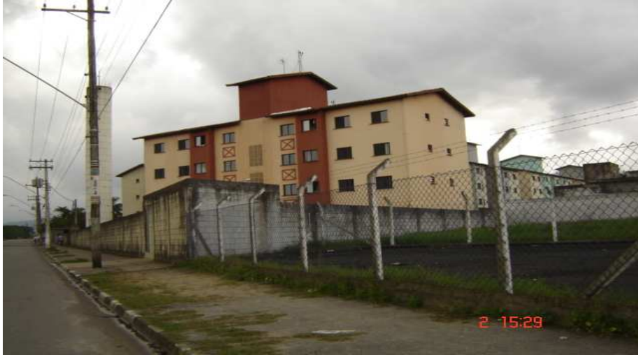
Primeiro conjunto habitacional desse bairro composto de prédios

Os moradores dos predinhos, como são conhecidos, e das poucas casas se orgulham do bairro por ser pequeno e aconchegante, apesar de longe do centro da cidade. Dependem do transporte alternativo e cuidam da região e das pessoas que lá residem com muita união, conforme relatam vários deles.