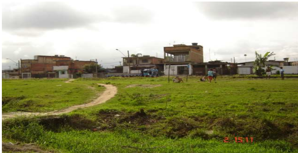
Início do Quarentenário

Seguindo a mesma Lei Complementar que se refere aos abairramentos, “o Quarentenário começa no cruzamento do prolongamento da linha divisória do loteamento Jardim Rio Branco, junto a Rua Augusto de Oliveira Santos, com a Rodovia Padre Manoel da Nóbrega, segue pelo eixo desta até o cruzamento com o prolongamento da linha divisória do loteamento Parque Continental, junto a Avenida 2; deflete à direita e segue por esta linha e seu prolongamento até o cruzamento com o Rio Mariana; deflete à esquerda e segue pelo eixo deste até a sua foz; deflete à direita e