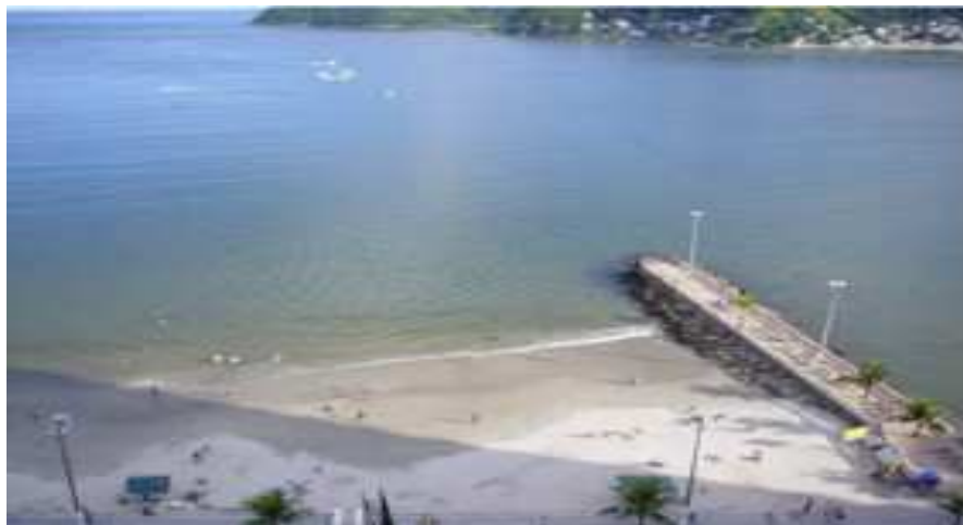
Pier da Praia dos Milionários

A Biquinha de Anchieta é um dos pontos turísticos mais visitados na atualidade; seus azulejos, conservados até hoje, mostram a catequização dos índios encontrados na ilha de São Vicente pelo Padre José de Anchieta.