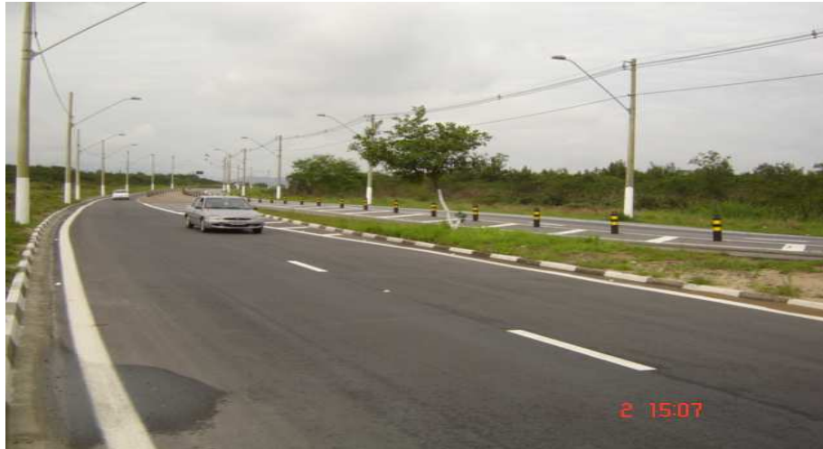
Foto da Avenida Angelina Prete, que liga ilha e continente

Sawaia (1999: 121) comenta que é a identidade que transforma espaços de segregação em guetos de resistência e de aconchego, em lugares com calor humano, um antídoto ao desprezo da sociedade. É essa sensação que os locais de moradia formados além da Ponte dos Barreiros transmitem, cria uma nova São Vicente, que se configurou como uma região de oposição à ilha. Sua ocupação se deu pela proximidade com a Rodovia Padre Manoel da Nóbrega, portanto, pelos limites da cidade-ilha.