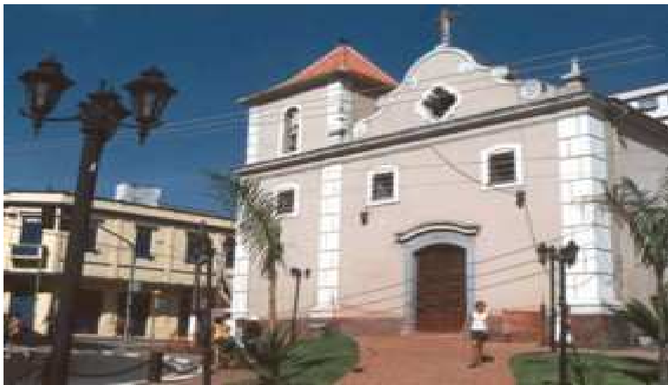
Igreja Matriz de São Vicente

Um outro atrativo é o “ pier ” construído na Praia dos Milionários, que serve de ponto de encontro e permite uma vista maravilhosa da Ilha Porchat e da Praia de Paranapuã, reserva ecológica preservada pela UNESP para estudos de biólogos.