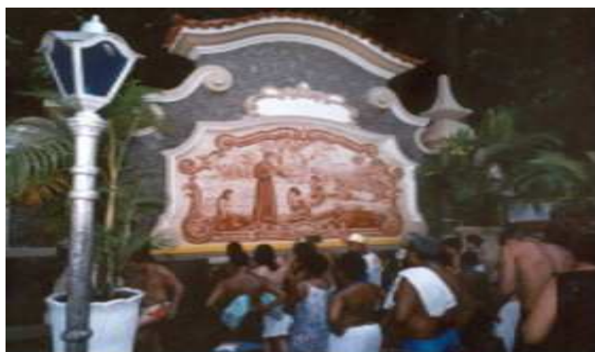
Biquinha de Anchieta