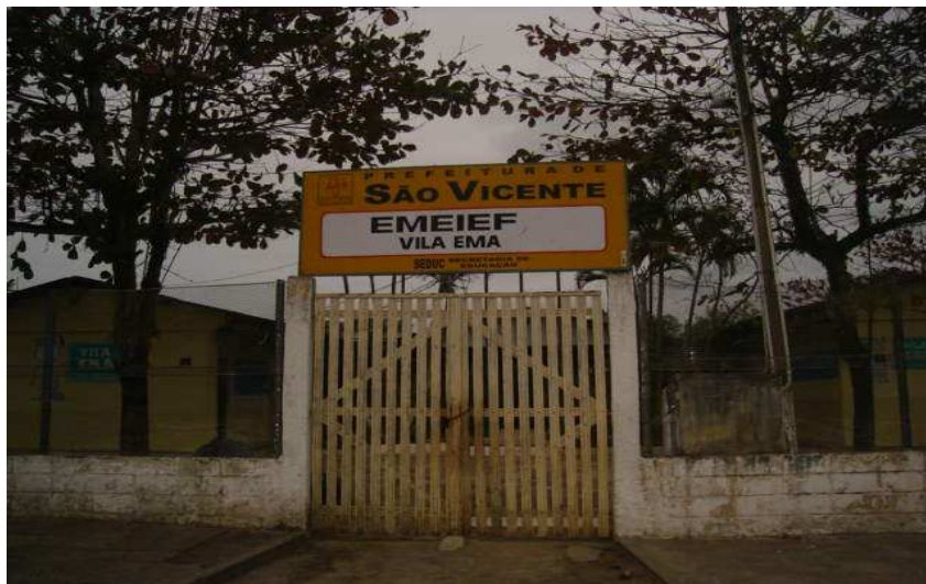
Entrada da EMEIEF para todos profº, funcionários, alunos e pais

A construção é bastante simples, mas as árvores e o espaço para as crianças brincarem é grande. Todas as atividades e festividades locais são feitas ali e com a