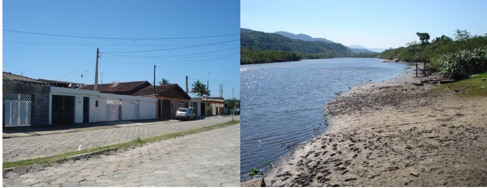
Foto da Gleba II, ao final do bairro o Rio Mariana.

Neste bairro o desenvolvimento corresponde à busca pelos bens e serviços como: segurança, emprego, lazer e moradia e são transformados e renovados no próprio bairro perante seu crescimento em termos de comércio, alimentação e lazer, espaço e mão-de-obra.