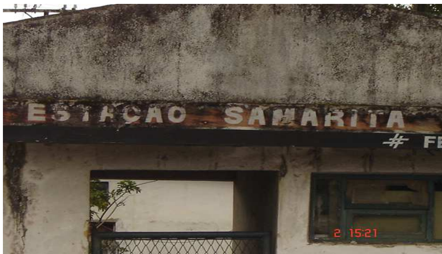
Portão de entrada da Estação ferroviária de Samaritá

As principais atividades econômicas desenvolvidas na década de 1980 foram sempre de pequena expressão para a cidade; ficaram circunscritas à exploração de recursos naturais ou a pequenas atividades agrícolas. Ainda na década de trinta, a Estrada de Ferro iniciou estudos para encontrar um local adequado, próximo a São Vicente, para a instalação de uma estação de embarque.