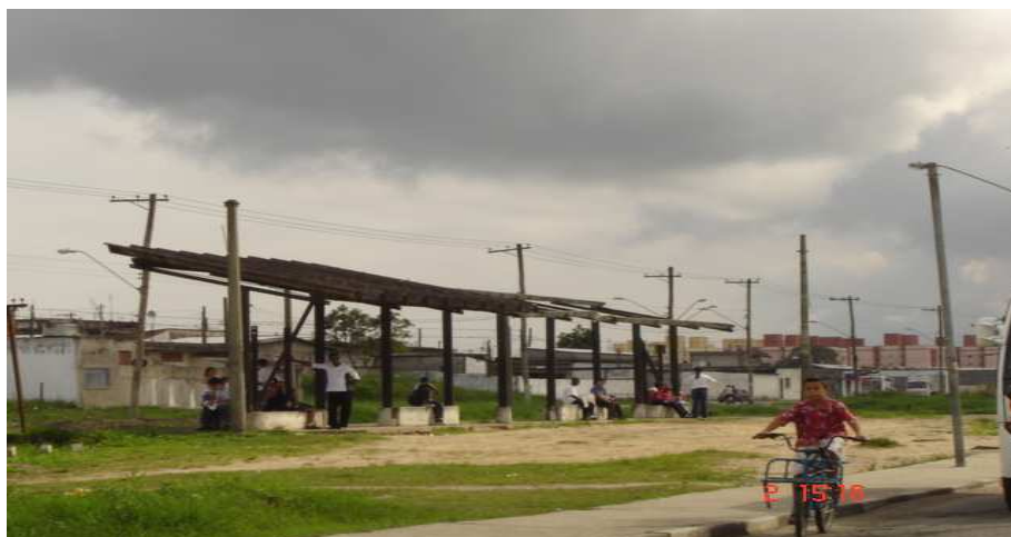
A maior parada de transporte do bairro

Em sua encosta, Rio Branco guarda um trecho conhecido como Jardim Rio Negro, que é fruto de invasões e não é reconhecido como outro bairro pela prefeitura; os moradores separam nitidamente os dois bairros, segundo a fala dos habitantes locais.