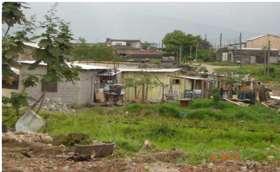
Áreas de invasão