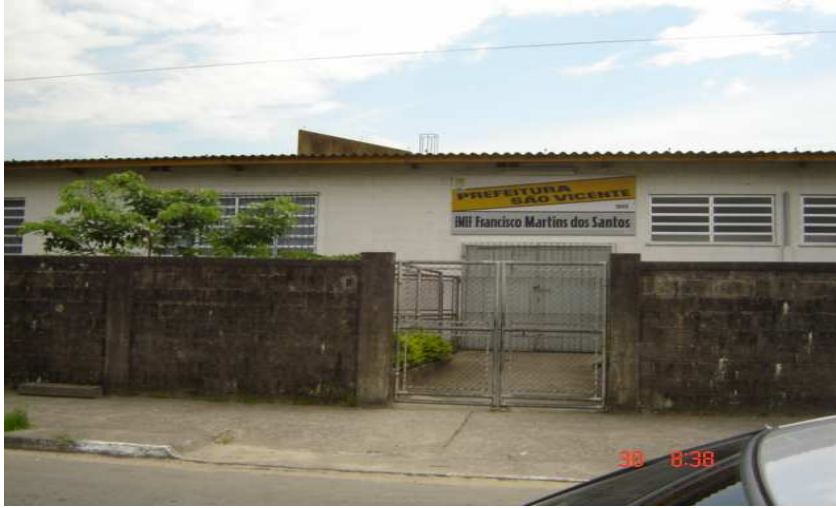
Entrada principal reservada aos alunos da EMEF Francisco Martins

Os funcionários são todos do próprio bairro e mantêm uma relação de amizade com os pais de alunos, o que favorece o relacionamento escola/comunidade. A direção também permanece inalterada há dez anos. Por dentro, dá a sensação de uma casinha de bonecas.