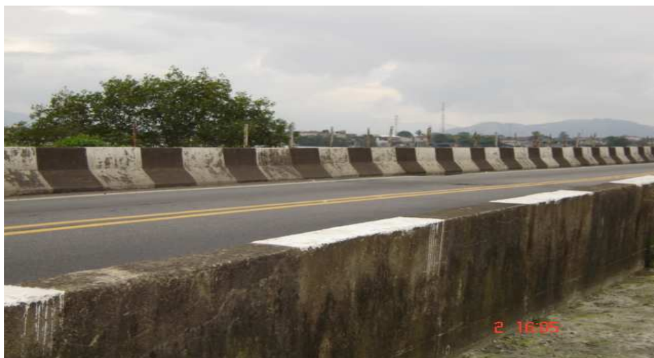
Ponte dos Barreiros que liga continente e ilha.