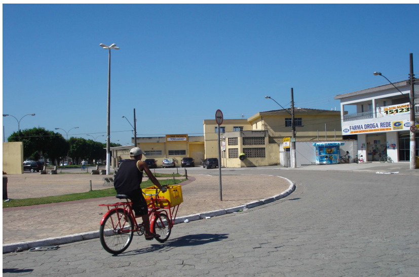
Início do Bairro Parque das Bandeiras, gleba I