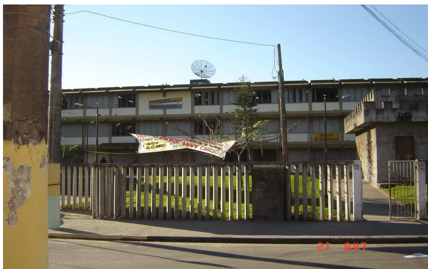
Entrada de professores e alunos da EMEF CAIC

O CAIC (Centro de Atendimento Integral à Criança e ao Adolescente) Ayrton Senna da Silva, situada no bairro do Humaitá, é uma imensa escola de ensino fundamental, inclusive com educação de jovens e adultos. Funciona também como um grande centro comunitário. Abriga, ainda, um posto de saúde e uma creche municipal com berçário, funcionando doze horas por dia. Por ser um bairro próximo à Serra do Mar, é sempre sombrio e, mesmo no alto verão, as pessoas usam casacos ou roupas de meia estação.