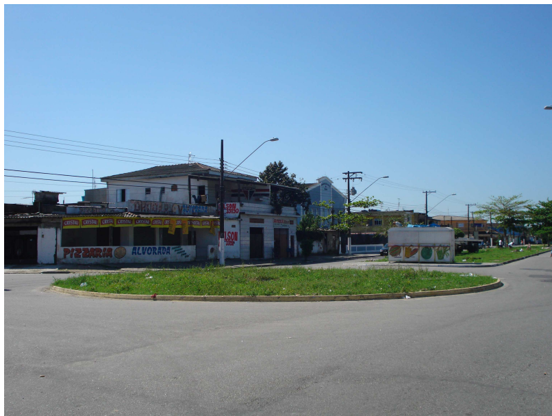
Praça no início do bairro Parque Continental

O abairramento do Parque Continental “começa no cruzamento do Rio Branco com a linha imaginária traçada perpendicularmente à Rodovia Padre Manoel da