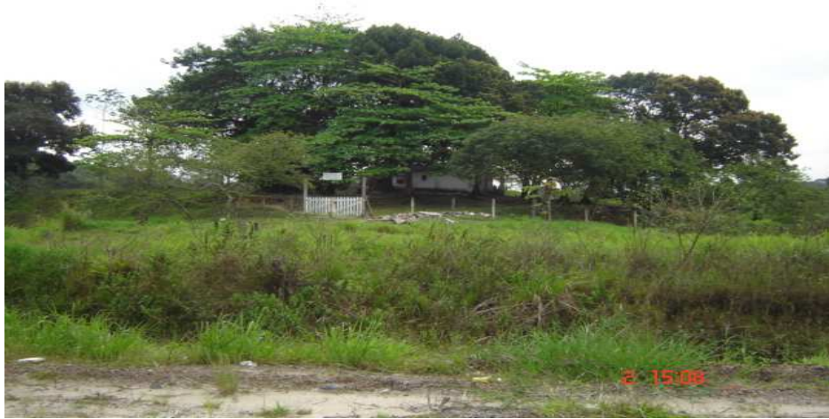
Casa próxima a Ponte dos Barreiros

A pretensão de invadir essa área próxima à rodovia deve-se ao acesso rápido ao centro da cidade, mas a prefeitura e os policiais militares florestais impediram, porque ali se localiza uma reserva de mangue, com uma biodiversidade específica do local, que precisa ser preservada.