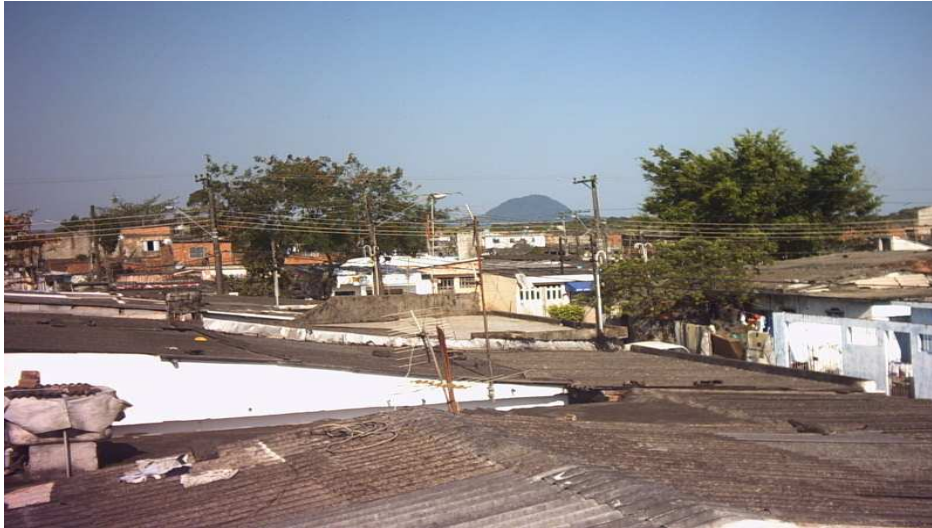
Vista aérea do bairro: Fonte: Márcia Vale

O bairro começa no “cruzamento da linha divisória entre o loteamento Parque Continental e o Conjunto Residencial Humaitá com a Avenida C; segue pelo eixo da Avenida C até a confluência com a rua D; deflete à direita e segue pelo eixo da Rua D até a confluência com a linha divisória entre o loteamento Parque Continental e o Conjunto Habitacional Humaitá; deflete à direita e segue por esta até o ponto de partida”.