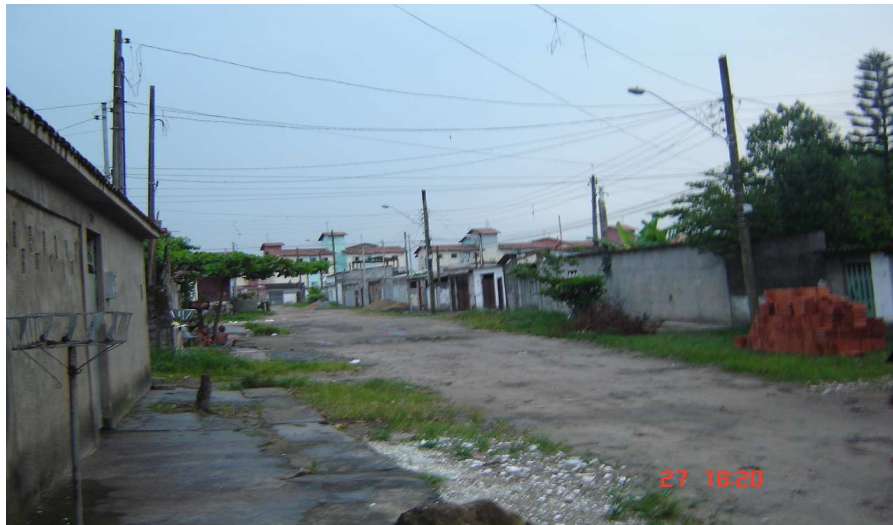
Início do bairro: Fonte: Márcia Vale

O bairro fica próximo do Samaritá e mais parece um desmembramento dele. Há uma indefinição sobre quando começou e sobre seu nome. É pequeno em relação aos outros bairros. Suas ruas são largas e de areia branca. As casas parecem fazer parte de um mesmo edifício, são iguais na construção e no tamanho dos terrenos; poucos são os casebres de madeira.