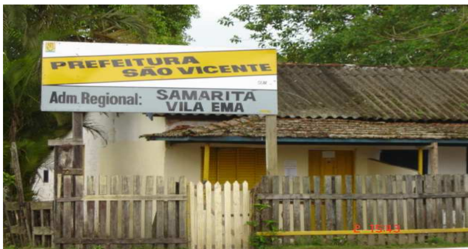
Regional onde se concentram os trabalhadores da prefeitura

Segundo a história contada pelos moradores, ela existe desde a década de cinquenta, em 1952, mas esses dados diferem dos já citados anteriormente porque fazem menção aos relatos dos moradores locais e não aos declarados pelos órgãos oficiais.