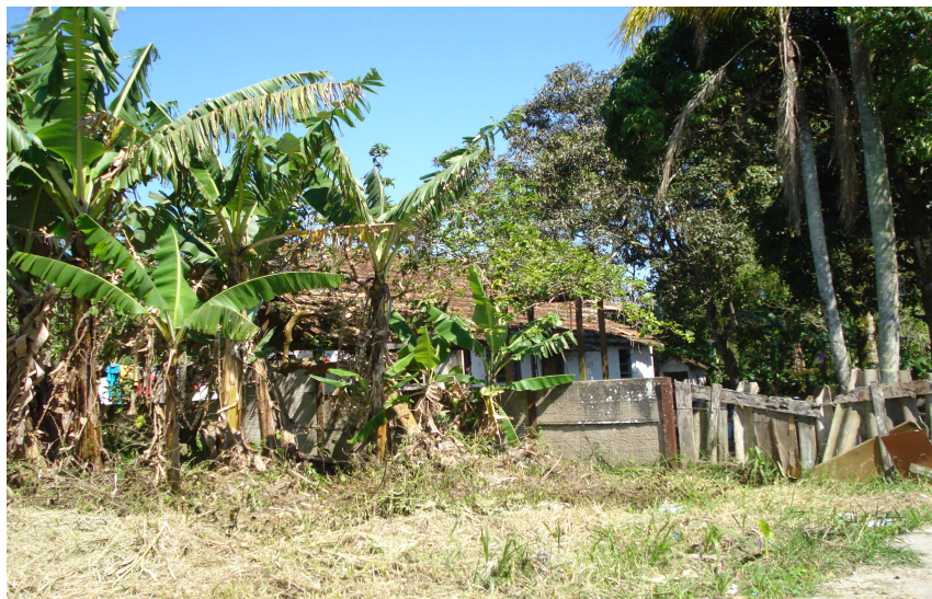
Sítio a beira da estradinha, residência típica desse bairro

Neste bairro os moradores pouco se conhecem ou se comunicam, escolhem seus pedaços de terra e vão construindo aleatoriamente; a grande maioria trabalha na ilha e apenas vem para casa à noite e, em muitas casas, as crianças ficam sozinhas durante o dia. Os irmãos mais velhos, com cerca de dez a doze anos, cuidam dos mais novos.