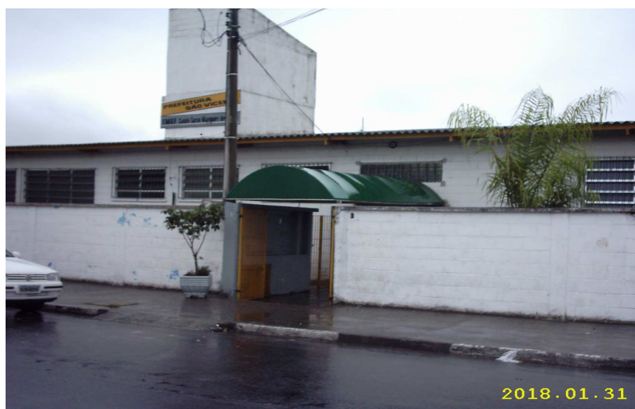
Fachada da escola EMEF Saulo de Tarso

A EMEF Saulo Tarso Marques de Mello é bastante próxima à comunidade. Os moradores do Parque Continental gostam dela e das pessoas que ali trabalham. É bem cuidada e tem aparência de escola particular, como comentam os moradores.