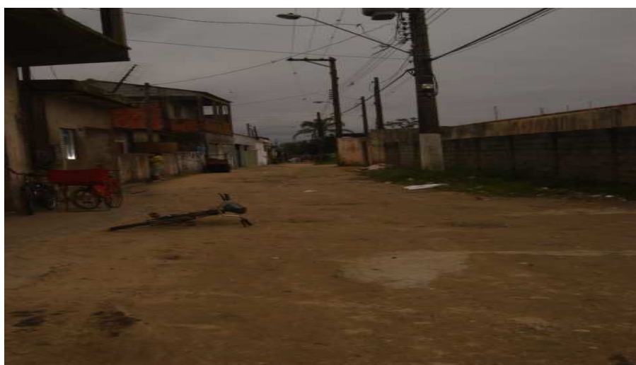
Início do bairro

O local é indefinido e não há concordância sobre onde inicia e onde termina. Os moradores são idosos e muitos afirmam estar ali há cinquenta anos. Na entrada do bairro antes de atravessar a linha férrea, há um bar freqüentado por homens e que marca o início do suposto bairro.