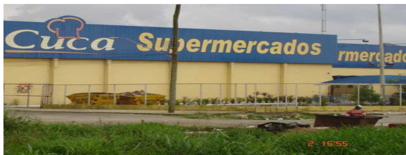
Supermercado CUCA, entrada do bairro Jardim Rio Branco