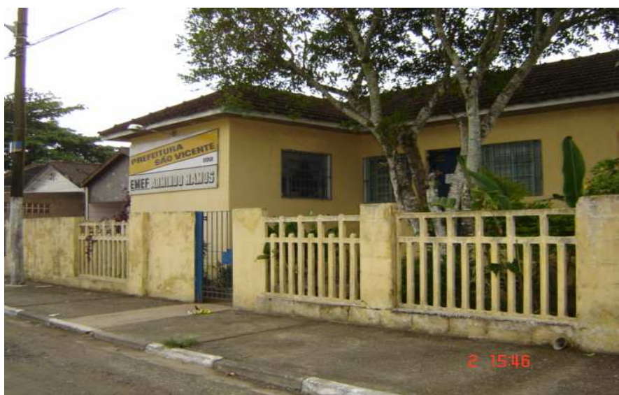
Fachada da EMEF Armindo Ramos

A EMEF Armindo Ramos, como mostra a foto, mais parece uma casa adaptada para abrigar uma escola. Os muros e portões baixos e a conservação demonstram sua aceitação pela população. Está localizada no bairro de Samaritá, um dos mais tranquilos da região. Seu número de alunos mantém-se estável, e a comunidade é participante e sem problemas de relacionamento com o corpo administrativo.