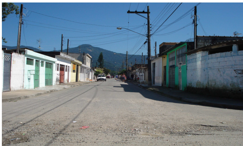
Rua do bairro Humaitá na entrada da Vila Nova Mariana