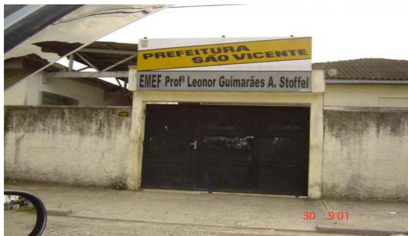
Entrada principal da EMEF

A EMEF Leonor Guimarães A. Stoffel, em Samaritá, é distante da população. O acesso é obscuro e cheio de voltas, os muros são altos e os corredores são estreitos e cobertos por telhas, o que impede a claridade. A estrutura e o tamanho das salas são bons.