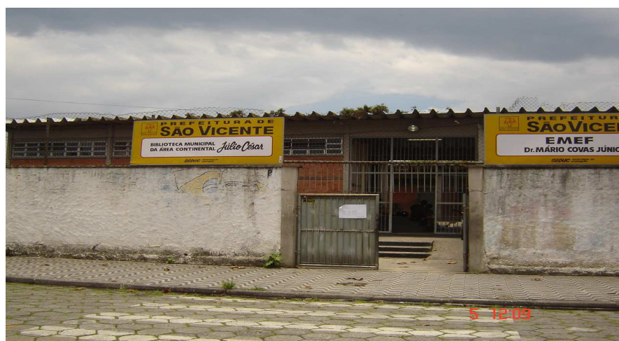
Entrada de funcionários e professores da escola

A EMEF Dr. Mario Covas é de porte médio e foi construída recentemente para abrigar o ensino fundamental no Parque das Bandeiras. A população tem enorme respeito pela estrutura física da unidade. Os pais procuram contribuir com a Associação de Pais e Mestres com certa frequência e com tudo que a escola se propõe a realizar.