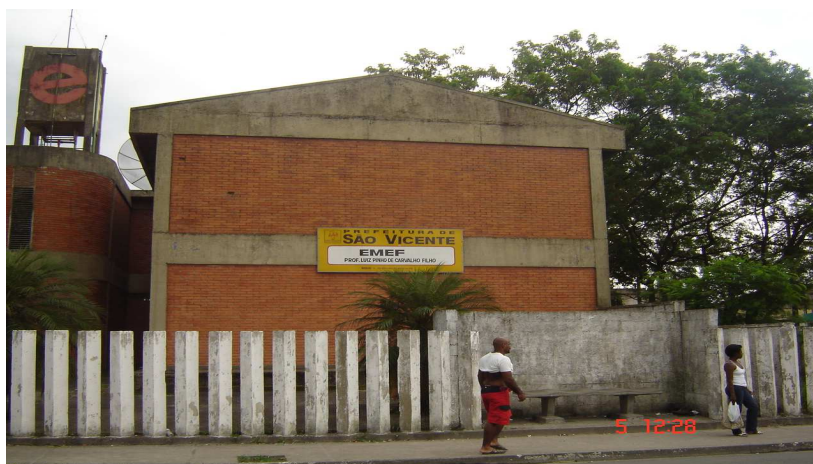
Prédio da escola

A EMEF Luiz Pinho de Carvalho Filho, no Humaitá, não tem um bom relacionamento com a comunidade. Os pais reclamam da administração e das constantes mudanças de vice-direção e coordenação; em 2007 foram três. A relação entre pais e