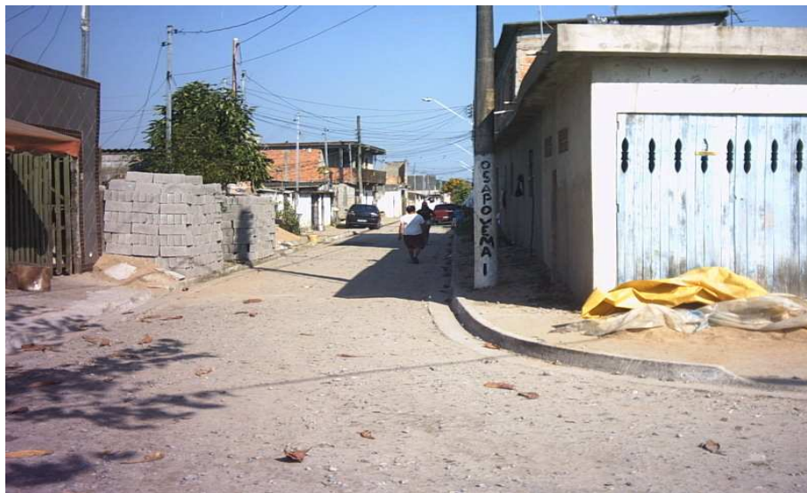
Entrada do bairro: Fonte: Márcia Vale

A cultura de serem hostis na primeira conversa, existe no bairro e é vista em outros bairros também formados por invasões é fruto do medo de serem retirados do local. Afinal, eles sabem que estão em uma área de preservação ambiental. “De qualquer modo, o divórcio ocorrido entre a ordem natural e a cultural foi responsável