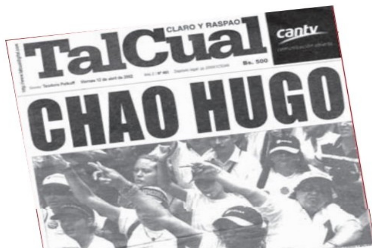
5- Primeira Página do jornal Tal Cual do dia 12 de abril de 2002 ( DEFENSORIA DEL PUEBLO , p. 38)

Seguindo o mesmo diapasão, o diário Últimas Noticias colocou em sua Primeira Página que Chávez havia se rendido, algo que não havia sido confirmado na ocasião e que mais tarde se demonstraria como uma falsa especulação, uma vez que o presidente venezuelano não renunciou, mas foi deposto por um golpe de Estado.