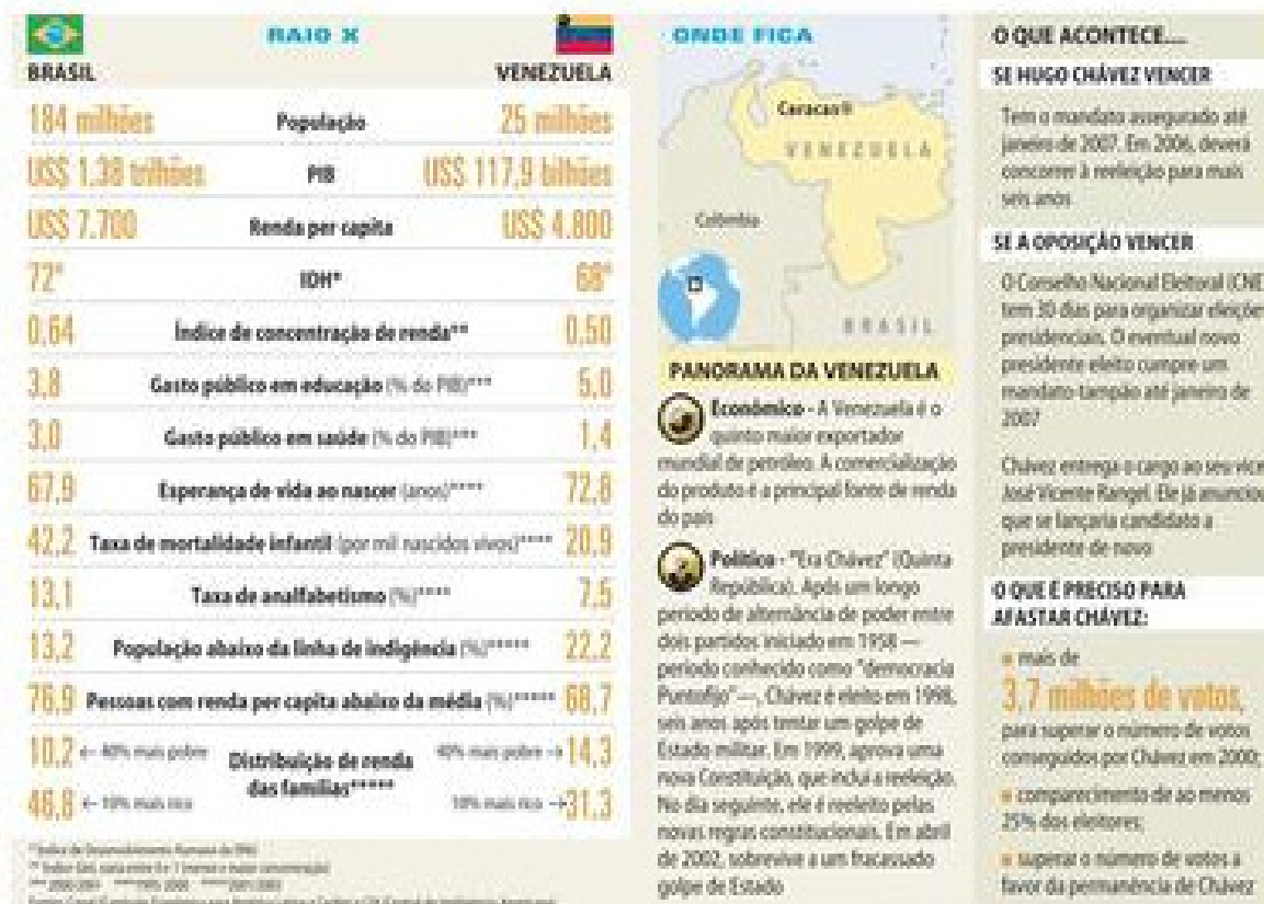
Figura 1. Folha de S. Paulo, 15/08/2004, p. A26