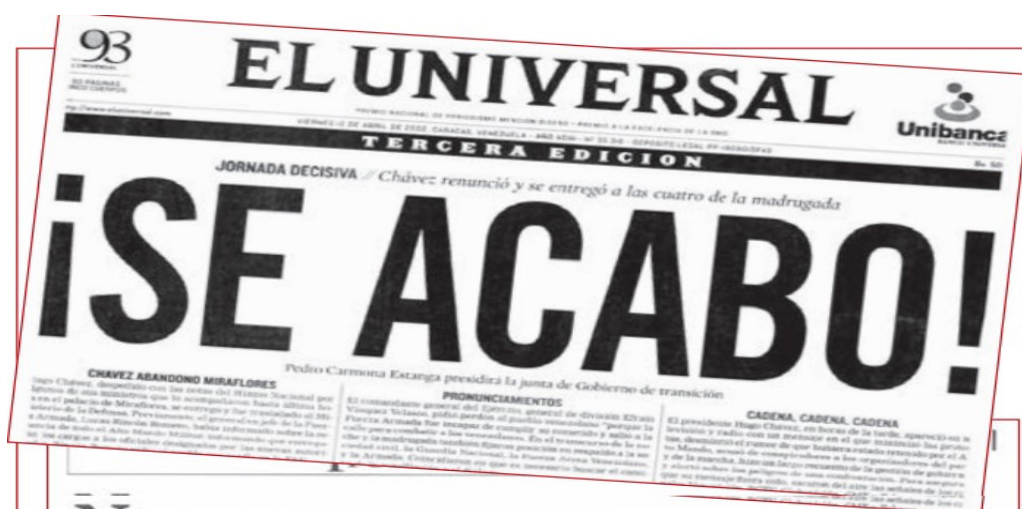
4 Primeira Página do jornal El Nacional do dia 12 de abril de 2002 ( FUNDACIÓN DEFENSORIA DEL PUEBLO , p. 36)

Portanto, para o jornal Folha de S. Paulo não importava o fato dos meios de comunicação defenderem e incentivarem o golpe contra Chávez, conforme se pode observar nos editoriais dos jornais venezuelanos. Como exemplo, podemos citar o El Nacional , que em 12 de abril de 2002 vinculou a seguinte manchete em sua Primeira Página: “ SE ACABÓ! Chávez renunció y entrego a las cuatro de la madrugada ” ( EL NACIONAL apud BRITTO GARCÍA, 2012, p. 114).