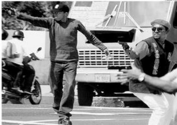
Supostos simpatizantes do presidente Chávez atiram em manifestantes da oposição em Caracas

O Centro Carter e a OEA, no entanto, afirmaram que os dados do CNE coincidem com as projeções