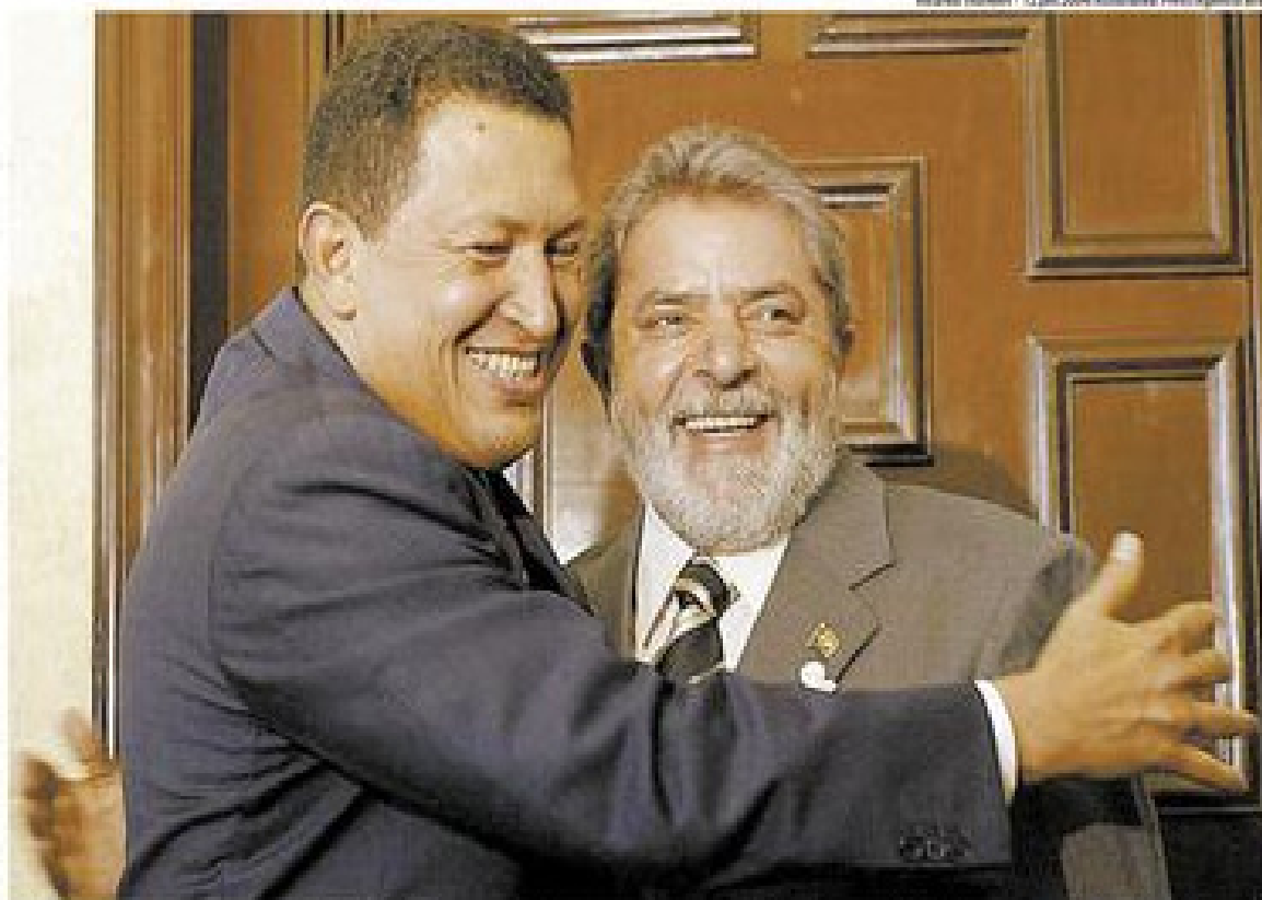
Chávez e Lula se abraçam em cúpula no México, em janeiro, quando o venezuelano disse ao brasileiro que venceria o plebiscito