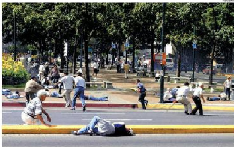
Venezuelanos se jogam no chão para se protegerem dos disparos de supostos apoiadores de Chávez, no centro de Caracas.

A arrecadação federal em julho, de R$ 38,354 bilhões, foi a maior da história para o mês. Pág. B11