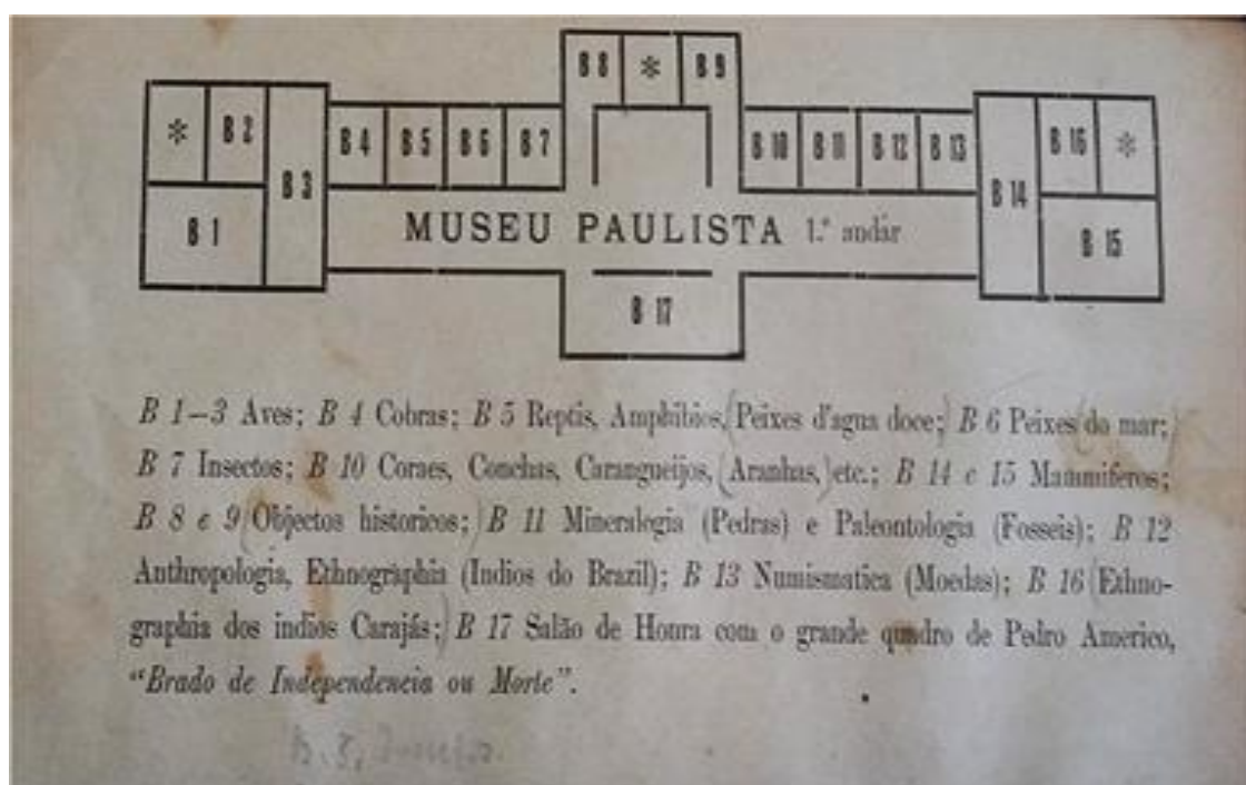
Fotografia nº 6: Mapa das exposições do Museu Paulista com respectivas legendas, p. 6 do Guia pelas Coleções do Paulista (1907).

Mesmo com dificuldade de espaço, as exposições foram montadas. De acordo com a planta do Museu, as exposições para o público se distribuíaam por 17 salas nas quais eram distribuídas as coleções de Zoologia, Mineralogia, Paleontologia, Arqueologia, Antropologia, Etnologia e História Pátria.