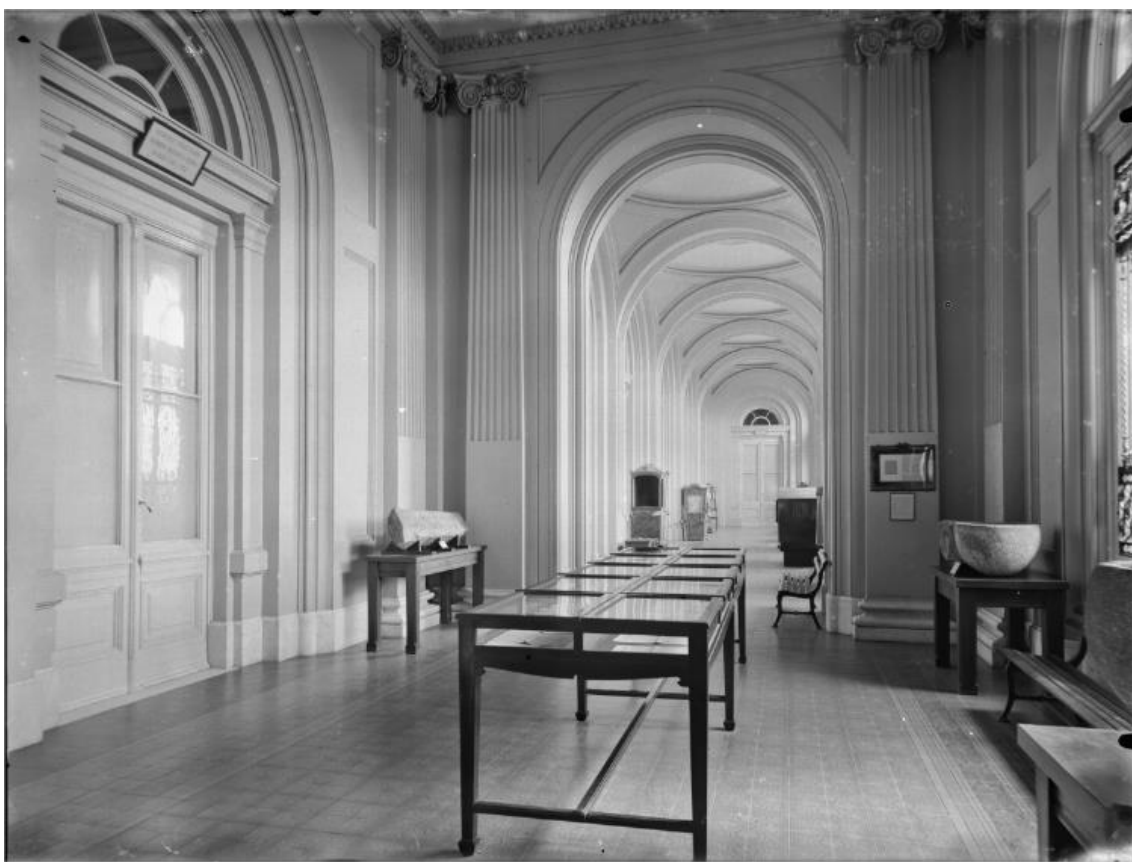
Fotografia n° 11: Museu Paulista galeria oeste aspecto antigo.

No caso do Museu Paulista, a construção do olhar mediado pelos objetos, visa construir uma forma de conhecimento, ou seja, busca-se proporcionar ao público instrução por meio de objetos, com forte apelo sensorial.