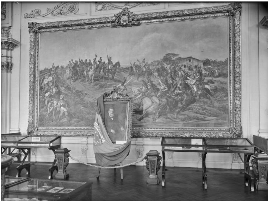
Fotografia nº 5: Exposição de Prudente de Moraes Republica – década de 1940.

No primeiro plano do quadro, figura D. Pedro I, o proclamador da Independência, primeiro imperador do Brasil, e Prudente de Moraes foi o primeiro presidente civil eleito por voto, sucedendo o Marechal Floriano Peixoto. 60 Como a foto foi feita nos anos 1940, não se pode transportar essa narrativa para a década de 1910. Entretanto, vemos que o quadro de Pedro Américo está ao centro do principal salão do Museu (salão solene) que pretende enaltecer a história construída pela narrativa do quadro. Museu, salão e quadro, organizam a marcação de que houve um grande acontecimento da história nacional naquele lugar. E lá instalado, permaneceu até os presentes dias.