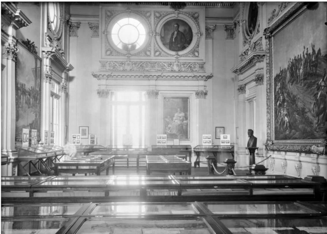
Fotografia nº 10: Salão Nobre.

Mas o principal ponto de atração de todos os visitantes da cidade é o Ipiranga, o magnífico monumento erigido em 1885 no lugar onde foi proclamada a independência do Brasil em 1822. É a mais bela realização da arquitetura brasileira, planejada não só para comemorar esse glorioso evento, mas também para servir como “instituição de conhecimentos”. O Museu do Ipiranga possui tesouros de grande interesse histórico e científico, valiosas e curiosas relíquias e também algumas das melhores pinturas de artistas brasileiros. (Wrieth, 1981, p. 136-137).