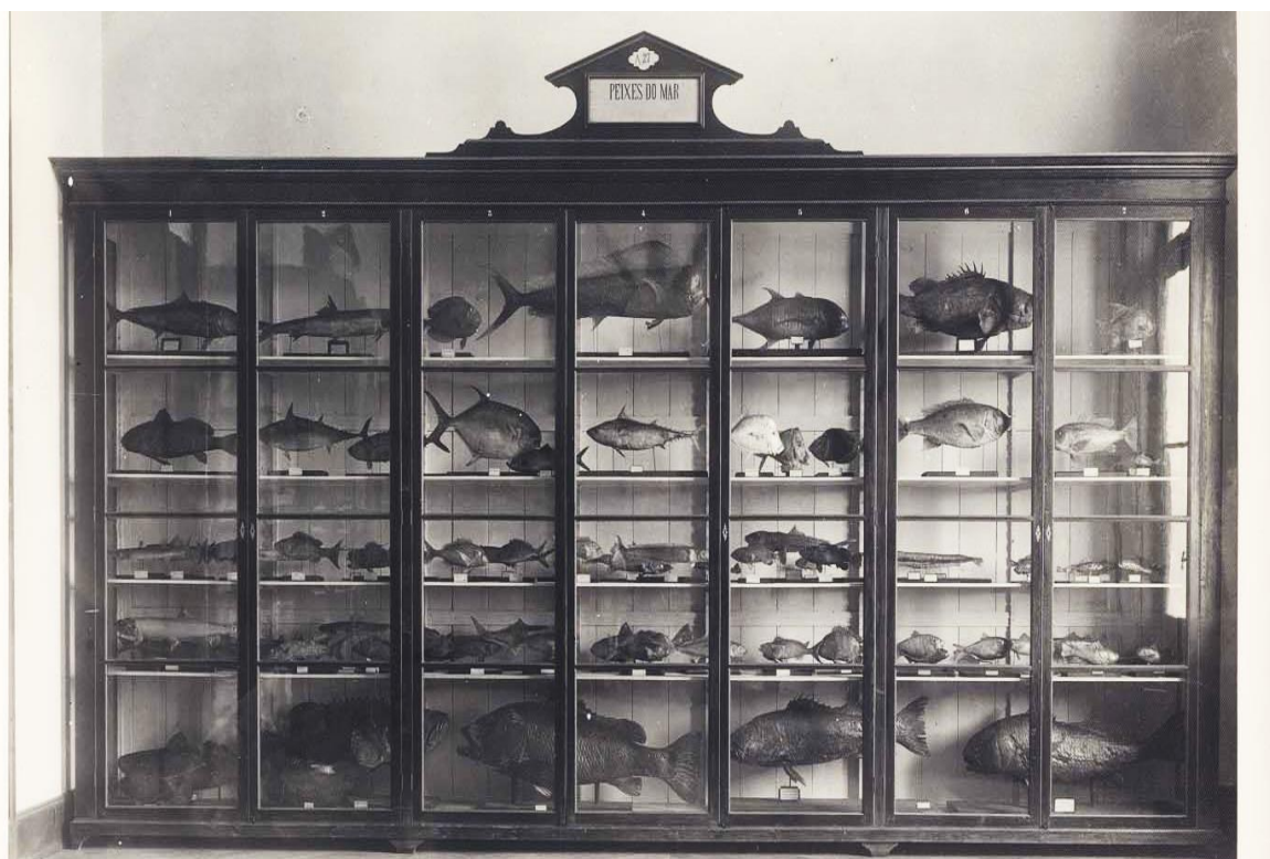
Fotografia nº 9: Sala B6 - Peixes do Mar. Formada pelos armários 27, 28, 29 e 30.

A mesma consideração podemos fazer da sala B 6 em relação com a sala B 3: o armário denota uma forma racional de apresentação dos objetos, facilitando o entendimento do que se vê; apesar de haver uma grande quantidade de objetos expostos, estes não deixam transparecer um aspecto confuso e poluído, o que dificultaria a intenção de instruir.