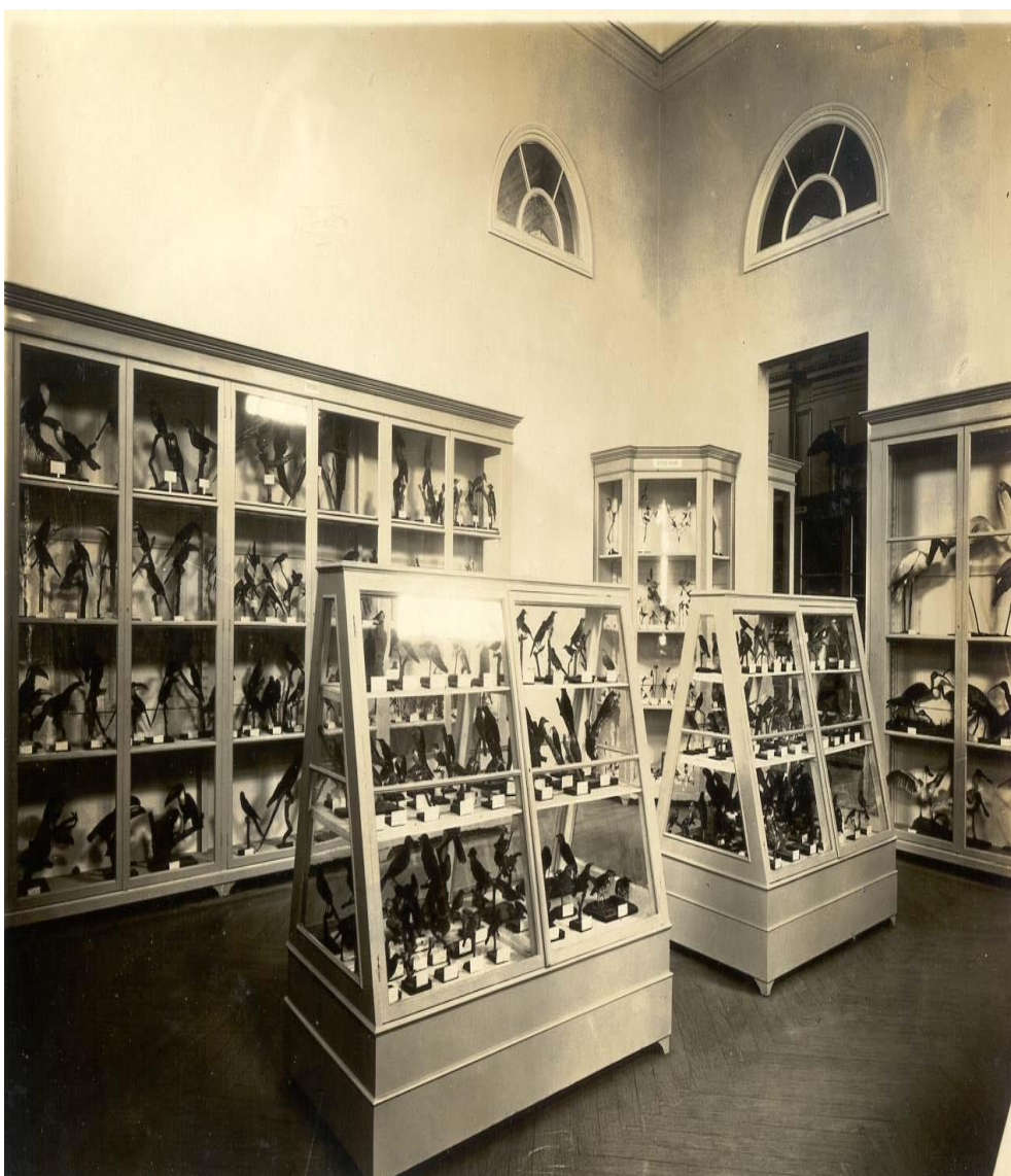
Fotografia nº 7: Sala B1 - Aves.

variegado; outro lado seria a questão utilitária das informações: perigos para as plantações; nesse caso, as espécimes Araras, Papagaios, Anacã, Jandayas, Periquitos e Tuins seriam danosos ao trabalho agrícola, e também o lado grotesco de determinadas espécimes, no caso, os Tucanos. Chama a atenção a questão didática referente aos animais úteis e nocivos dadas pelas Lições de Coisas. A forma como a descrição é feita pelo Guia do armário 1 revela a intenção de orientar o modo de olhar do visitante, procurando direcionar sua atenção para aqueles detalhes, ou seja, os detalhes revelam a intenção (Ginzburg, 1989).