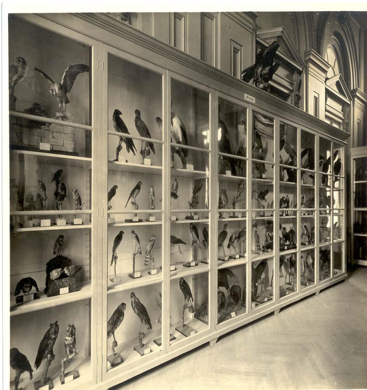
Fotografia nº 8: Sala B3 - Aves. Formada pelos armários 13, 14, 15, 16, e 18.

A Fotografia nº 8 traz a imagem de um armário da sala B 3. Trata-se do armário 18, segundo o Guia pelas Coleções do Museu Paulista (p. 88-89). Este seria o armário das aves de rapina. Pelo grande número de aves e a forma do arranjo das aves, expostas em armário/vitrines, a primeira impressão que nos passa é de estarmos num imenso viveiro; outro aspecto é a forma sequencial de apresentação dos espécimes dispostas de forma linear a facilitar a leitura e compreensão dos mesmos, todos identificado por etiquetas. Retomando a ideia de Ihering com a boa apresentação dos taxidermizados,