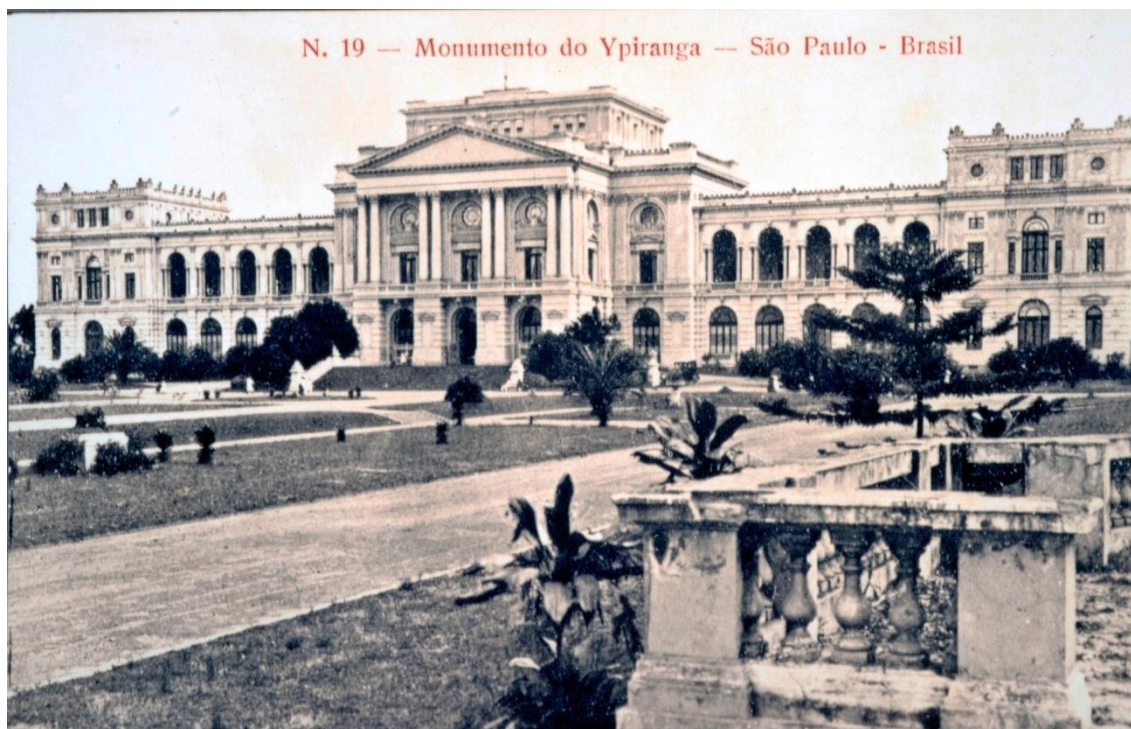
Fotografia nº 3: Monumento do Ipiranga s/d.

Deve-se considerar que, apesar de todas as dificuldades que o público encontrava para visitar o Monumento, este recebia um bom número de visitantes, pois não só o Museu era visitado: os jardins também eram utilizados para várias atividades. O público encontrou no Museu Paulista e em sua praça ajardinada um lugar para seu lazer.