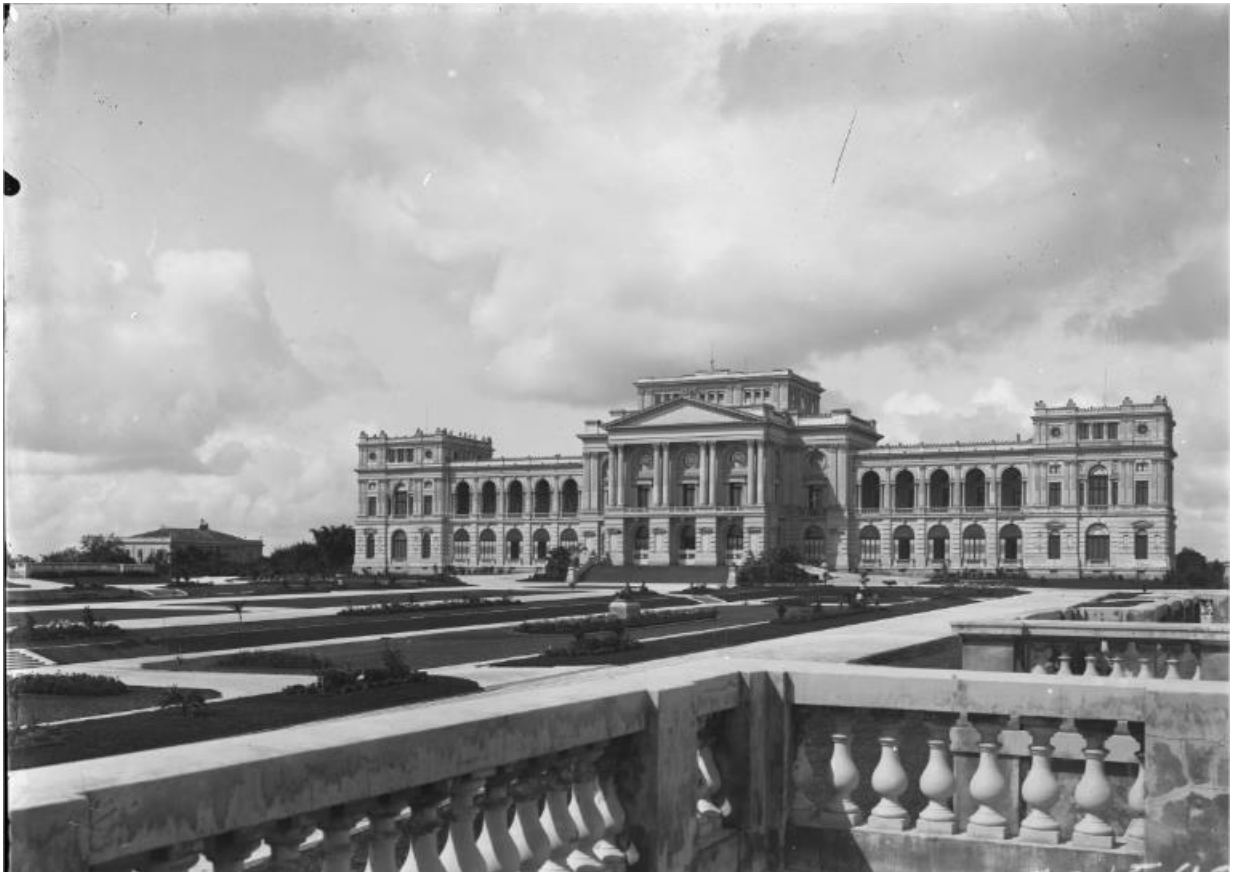
Fotografia n° 4: Jardim - Fachada do Museu Paulista início Sec.XX.

operários e trabalhadores; pela sua narrativa, detectamos que o Monumento do Ipiranga configurava-se como um espaço de lazer popular e pela qualidade do monumento, voltado à formatação de uma memória nacional, lazer instrutivo.