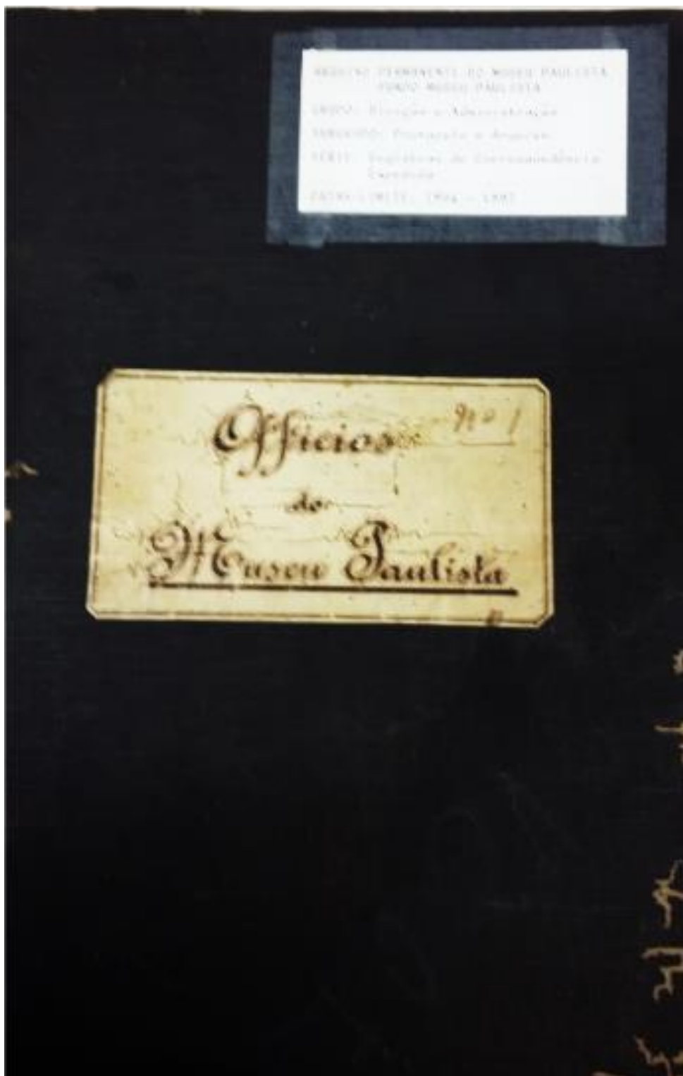
Capa do livro de crônicas do Museu Paulista.