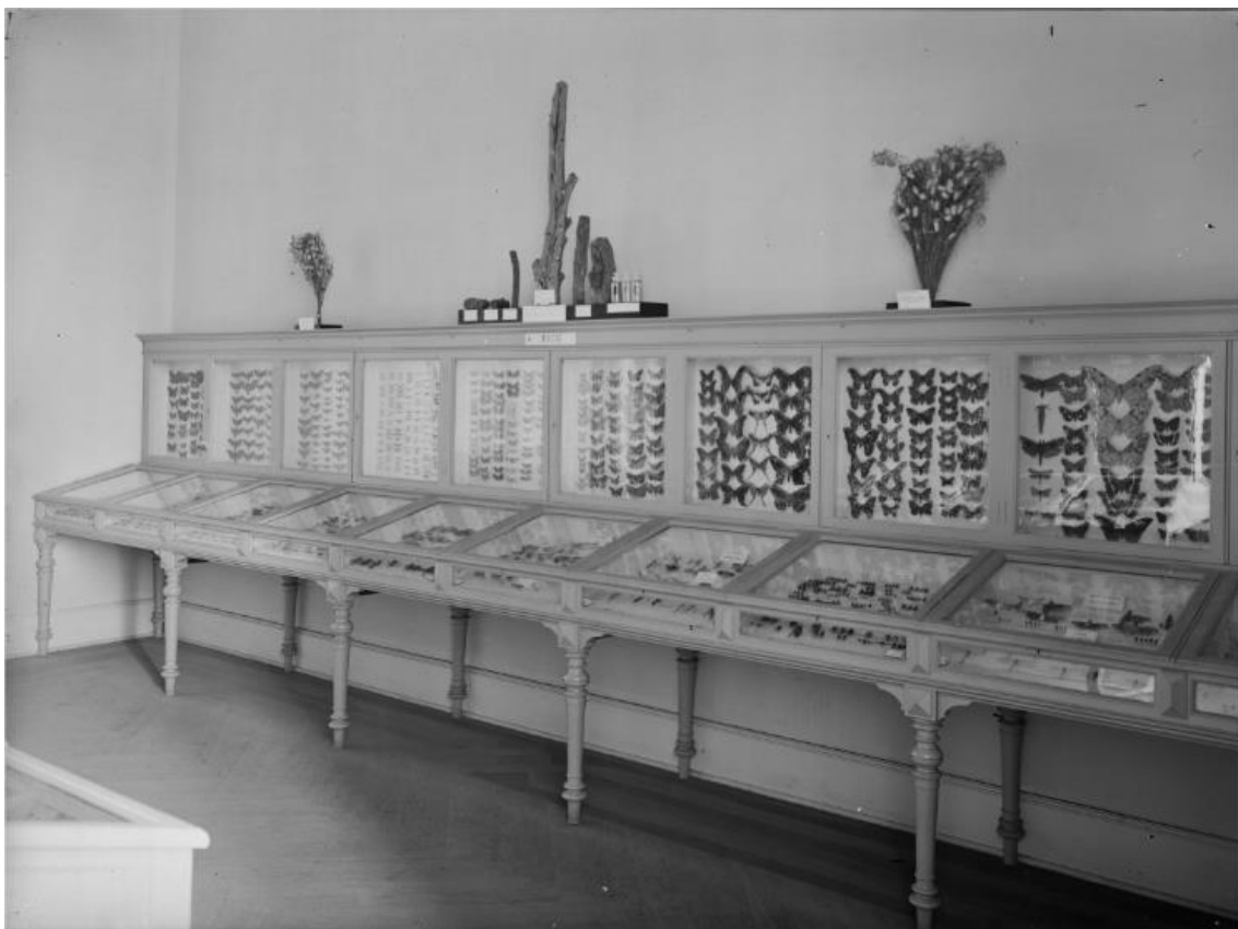
Fotografia nº 12: Sala de Entomologia.