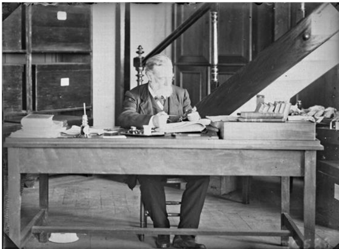
Fotografia nº 2: Hermann von Ihering sentado à mesa da diretoria do Museu Paulista. 40

Homem voltado à Ciência Natural, estudioso de vários assuntos, entre eles Antropologia, Etnografia e Administração de Museus, o diretor também era uma pessoa polêmica, não só devido ao seu caráter personalista, mas ao eurocentrismo em relação aos índios e a outros setores da sociedade.