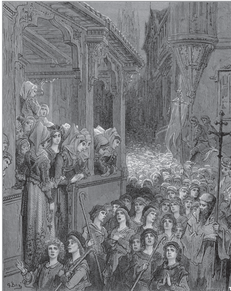
A Cruzada das Crianças , por Gustave Doré (1832-1883)

Numa cidade, debaixo da neve, lá pro leste, segundo se falava, uma cruzada de crianças, então, na Polônia começava.