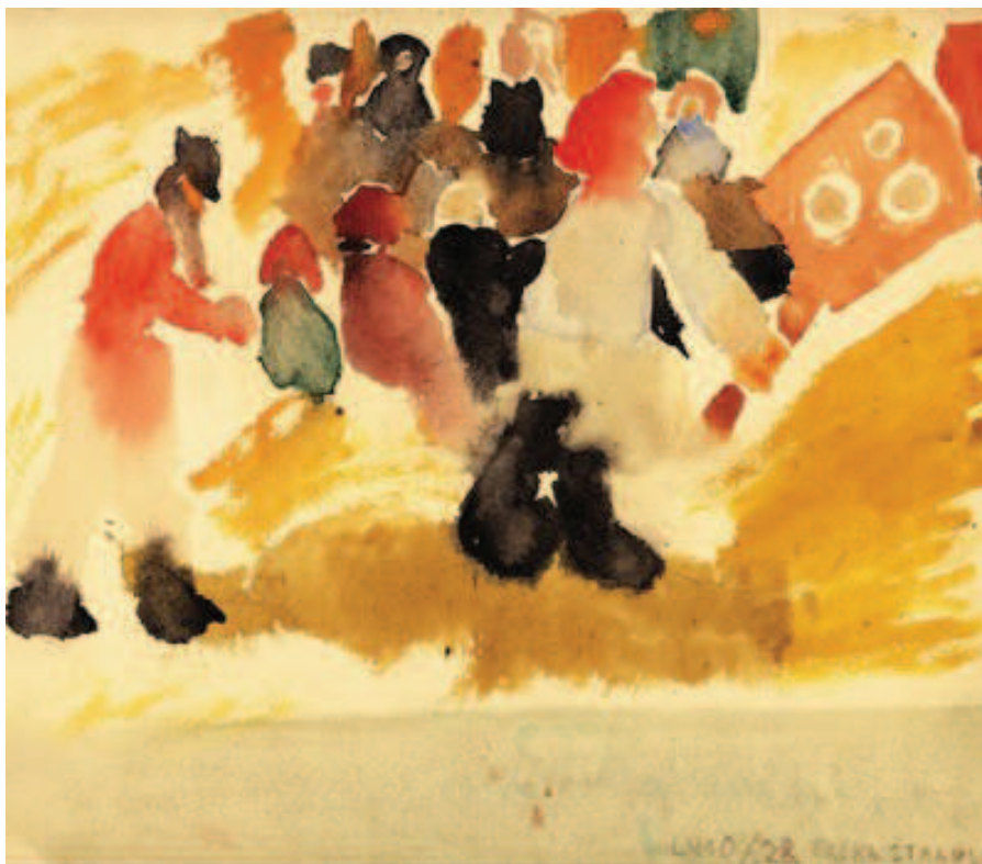
As meninas do quarto 28