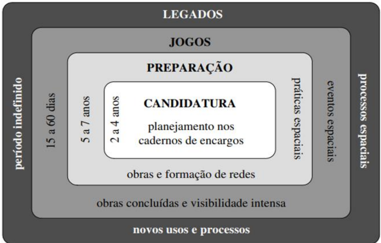
FIGURA 1: FASE DE IMPLANTAÇÃO DOS JOGOS OLÍMPICOS