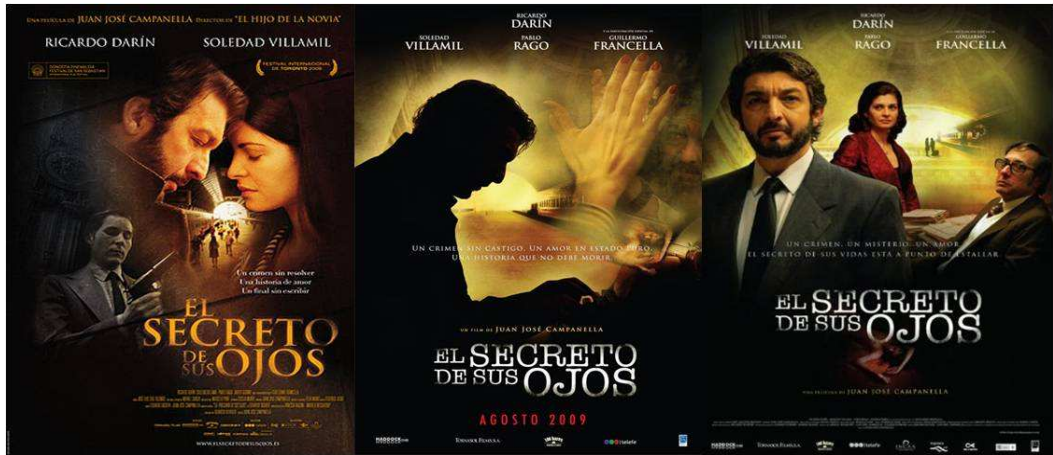
Cartazes de divulgação de El secreto de sus ojos .