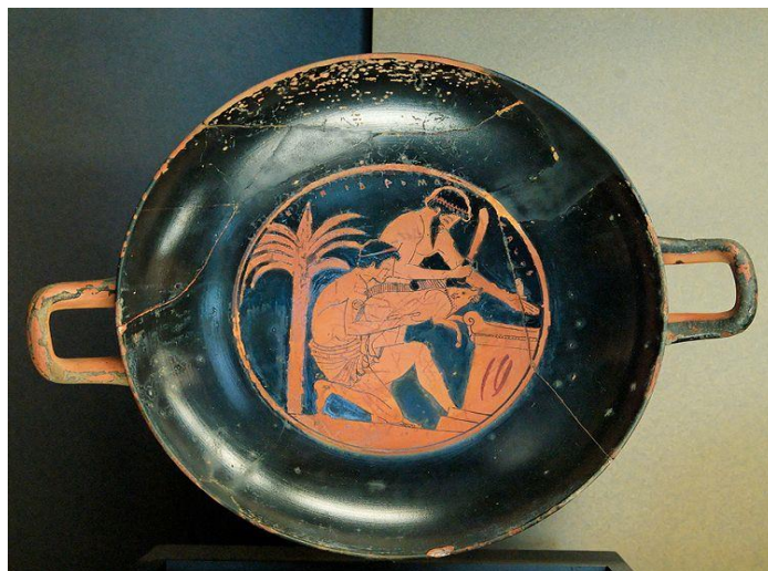
Sacrifício de um javali jovem e inscrição (ΕΠΙΔΡΟΜΟΣ ΚΑΛΟΣ), 510-500 a.C. (Fonte: Louvre. J.-C. Pintor Epidromos)

(Fonte: S. Karouzou, National Museum , Atenas, 1999)