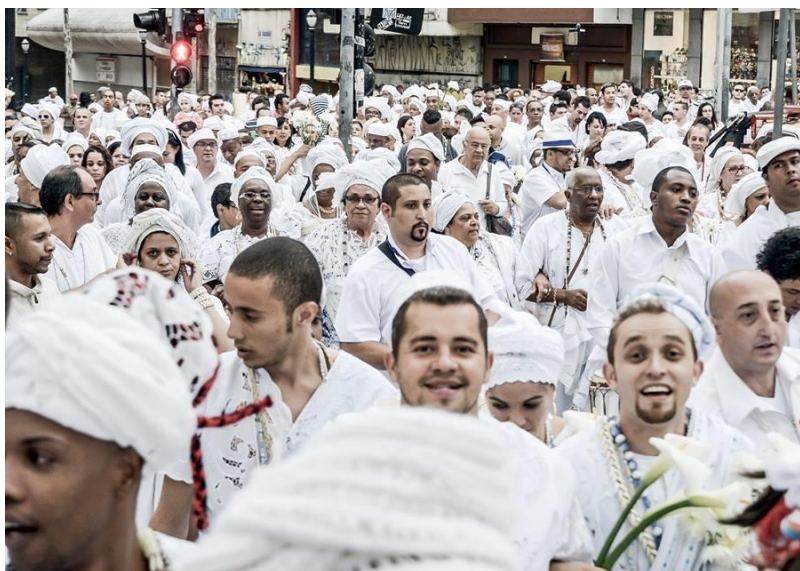
Caminhada rumo à Igreja Nossa Senhora do Rosário dos Homens Pretos

ruas do centro da cidade em direção ao largo do Paissandú. Local onde existe o tradicional ponto de referência da população negra na cidade – a Igreja Nossa Senhora do Rosário dos Homens Pretos, conhecida como “Igreja dos Escravos”. A caminhada seguiu ao som de atabaques, afoxés e cânticos do Candomblé.