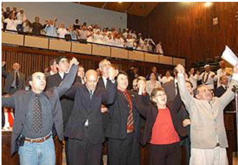
Deputados aprovam sacrifício de animais em cultos afros no Rio Grande do Sul 71