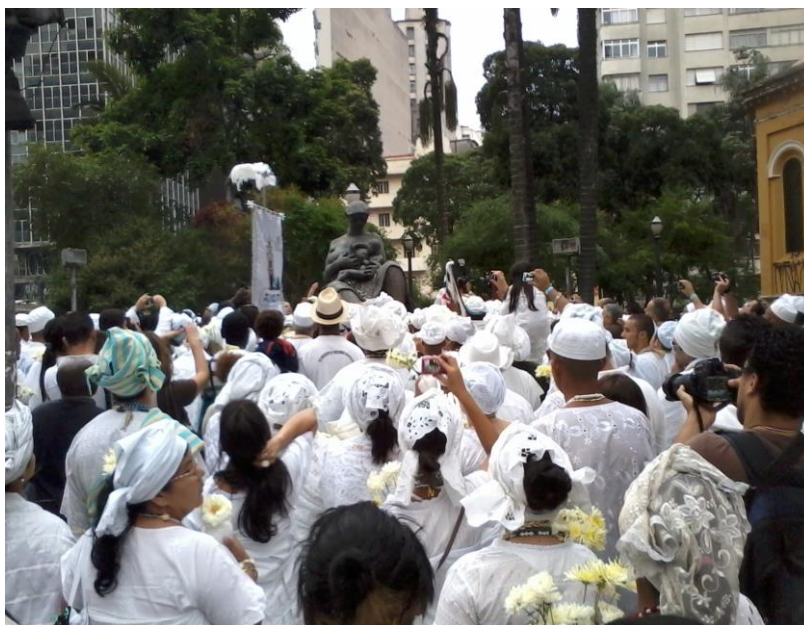
Povo de santo em frente à estátua da “Mãe Preta”

Ao chegar ao local, os adeptos das religiões de matriz africana fizeram, simbolicamente, a lavagem da estátua da “Mãe Preta”, ofertaram flores e fizeram a soltura de pombas brancas, em sinal de pedido de paz.