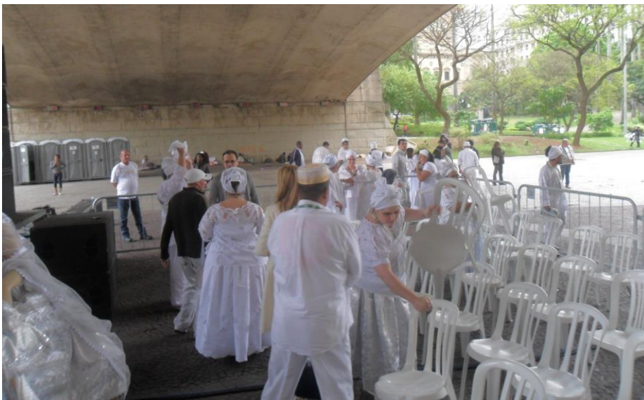
Os primeiros manifestantes chegando ao local de concentração do evento

Por volta de 10h30min da manhã, o povo de santo – Umbanda e Candomblé – reunia-se para o evento. Todos trajando roupas típicas, adornados com colares e guias coloridas, que simbolizam a identidade de santos e deuses destas religiões.