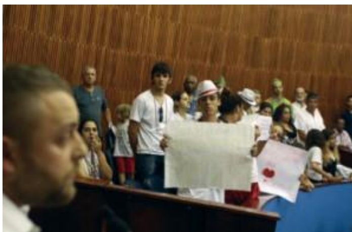
Manifestantes durante a sessão

A bancada petista, que votou e articulou a manutenção do veto, também organizou a presença de representantes de terreiros e religiões de matriz africana durante a sessão.