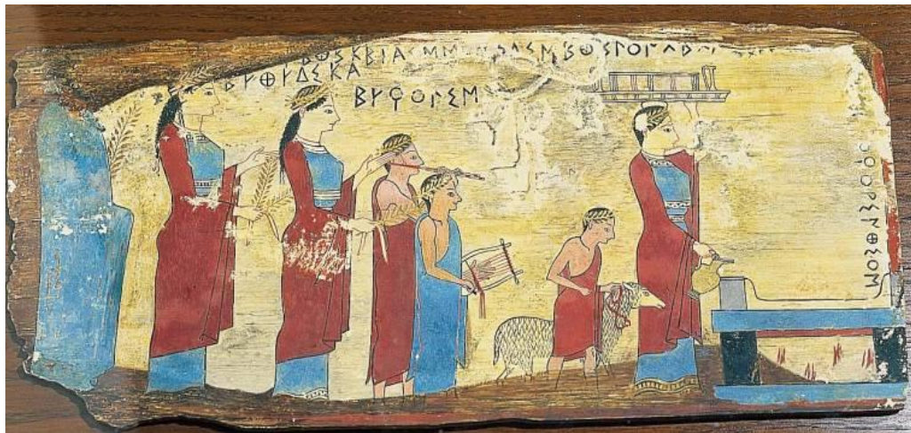
Procissão sacrificial. Pintura em tábuca de madeira da Caverna de Pitsa. Data: 540 a.C. Atenas, National Archaeological Museum. Moças com ramos de folhagem, um jovem com um aulos , um jovem com uma lira, um menino com um carneiro, um homem com vaso e bandeja nas mãos. Na extrema direita, o altar já com o fogo aceso.

O sacrifício de animais é uma prática ritual presente na história da humanidade desde aproximadamente 2.500 a.C, em várias civilizações e culturas, realizada como forma de estabelecimento da relação do homem com Deus.