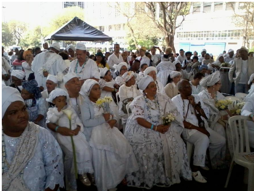
Com o passar de algumas horas, já havia um número significativo de pessoas no local