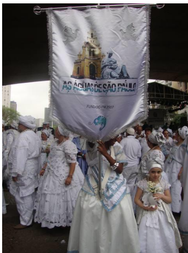
Estandarte do Movimento Águas de São Paulo

Conforme definido pelo organizador do evento – o babalorixá Ofanirê Momento – este seria o ponto alto do evento: a realização de caminhada pelas