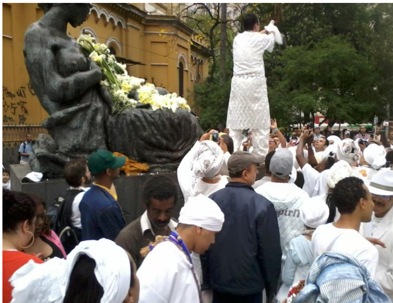
Soltura de pombas brancas

Ainda que existam tensões quanto à tentativa de impedir a continuidade dos rituais de sacrifício de animais nas religiões de matriz africana, pude perceber, nos rostos das centenas de pessoas que participaram deste evento, a alegria e a satisfação em estarem ali, num exercício de cidadania, lutando por suas liberdades de manifestação e de crença religiosa.