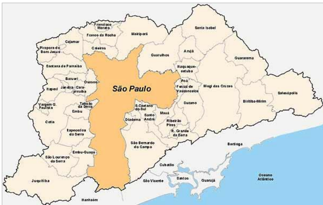
Planta geográfica da Grande São Paulo (municípios).

É importante comentar que obtive, também, informação que esses comerciantes são proprietários, ou mantêm relações comerciais com outros criadores e comerciantes proprietários de sítios e chácaras, localizados em municípios próximos da capital – como Mairiporã, Guarulhos, Ferraz de Vasconcelos, Poá, Itaquaquecetuba, São Bernardo do Campo e Diadema – e em municípios um pouco mais afastados da capital – como Mogi das Cruzes, Suzano, Santa Isabel, São Carlos, São Roque, Bragança Paulista, Itatiba, Praia Grande e Campinas, conforme mapa abaixo, – que funcionam como pontos de distribuição no comércio de animais.