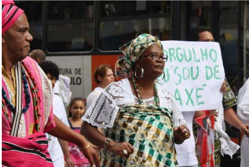
Manifestantes durante a passeata em repúdio ao PL 992/2011

rolamento da Avenida Paulista – e o fluxo dos veículos que circulavam em velocidade reduzida nas outras faixas de rolamento da via pública.