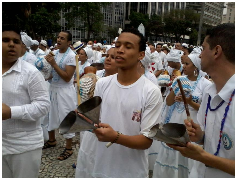
Adeptos da Umbanda e Candomblé entoam cânticos das religiões

Ao chegar ao local, os adeptos das religiões de matriz africana fizeram, simbolicamente, a lavagem da estátua da “Mãe Preta”, ofertaram flores e fizeram a soltura de pombas brancas, em sinal de pedido de paz.