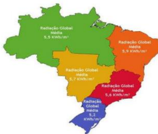
Imagem 2: Potencial de geração de energia fotovoltaica por região do Brasil

Outro ponto importante que dificulta a geração de energia nesta região é a vulnerabilidade do meio ambiente onde qualquer erro na produção de energia pode trazer impactos irreversíveis ao meio ambiente. A Amazônia legal é classificada como um local privilegiado, com intensa insolação e grande produção de biomassa. Porém, também é classificada como uma área ecologicamente sensível, onde há necessidade de toda a tecnologia adotada ser limpa, e nem sempre uma energia é totalmente aceitável. (PENHA,2019)