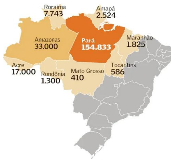
Imagem 1: Regiões do Brasil sem acesso à energia elétrica

Ou seja, se a energia for obtida a partir de sistemas fotovoltaicos descentralizados, todas as regiões passam a ter igual acesso à eletricidade, permitindo que diversas áreas rurais prosperem, aumentando a necessidade de mão-de-obra e, conseqüentemente, reduzindo os problemas sociais das regiões isoladas. (SHAYANI et al, 2006)