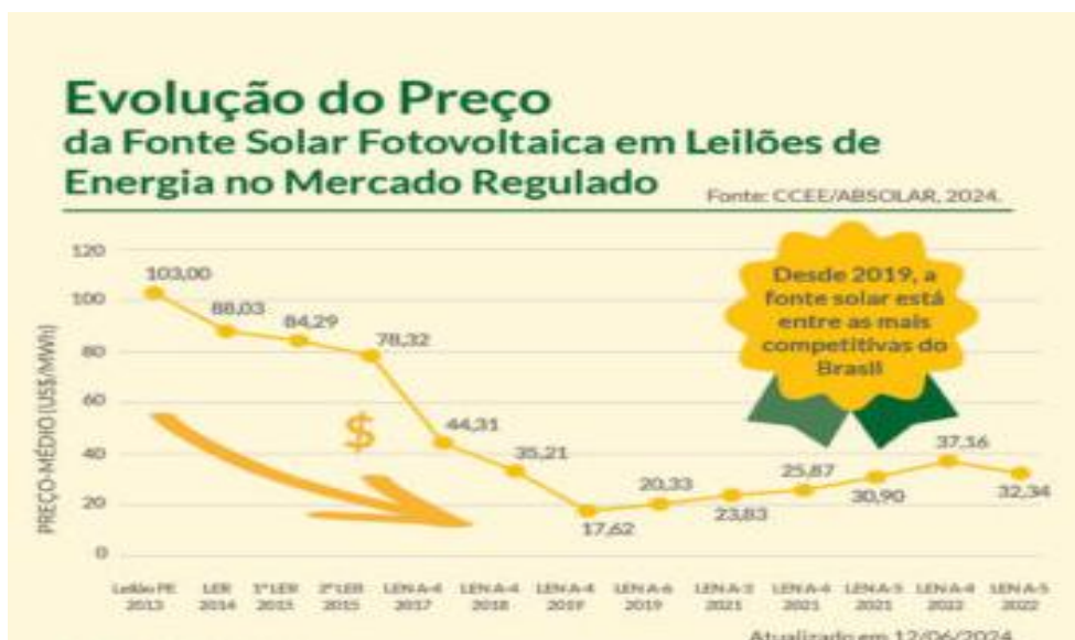
Gráfico 2: Custo dos sistemas Fotovoltaicos