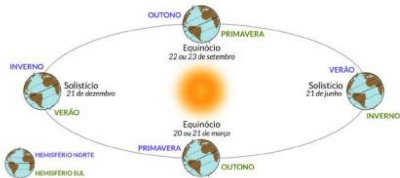
Imagem 4: Movimentos da terra