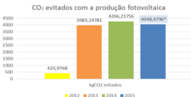
Gráfico 1: CO2 Evitado

Um caso a ser estudado é o da primeira micro usina de geração de energia fotovoltaica do brasil enquadrada na lei número 482, esta micro usina que foi construída pela empresa PGM Sistemas foi construída em 2012 instalada no telhado de um prédio com capacidade instalada de 6,58 kWh composta por 28 células fotovoltaicas, o objetivo foi desenvolver um estudo durante 4 anos sobre a produção desta micro usina.