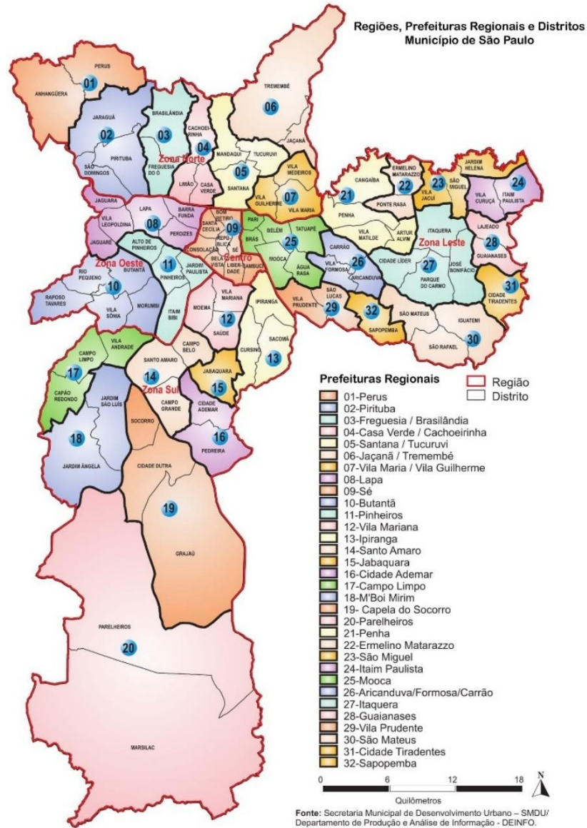
Figura 1 – Mapa das regiões, prefeituras regionais e distritos do município de São Paulo