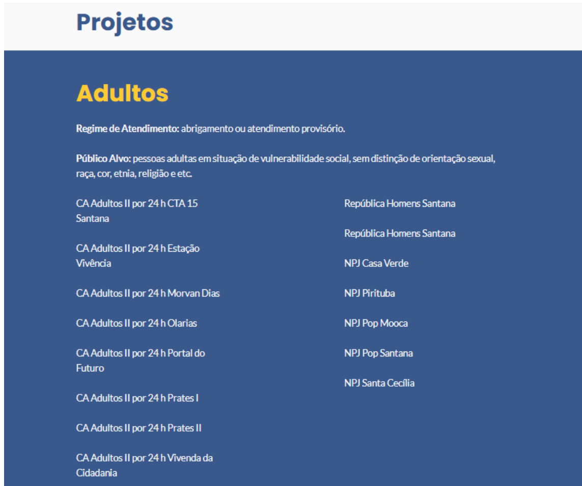
Figura 3 - Imagem da seção “Projetos” do site institucional da CROPH: