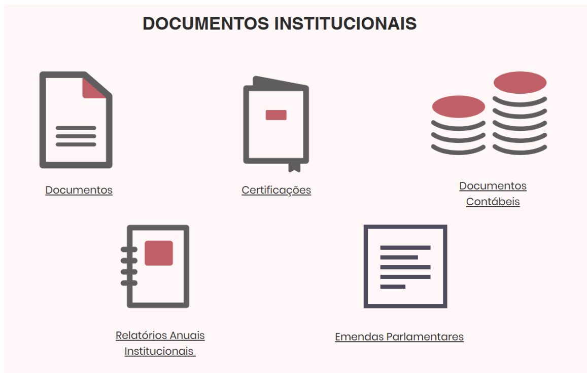
Figura 4 - Imagem da aba “Transparência” do site institucional da Associação Fala Mulher